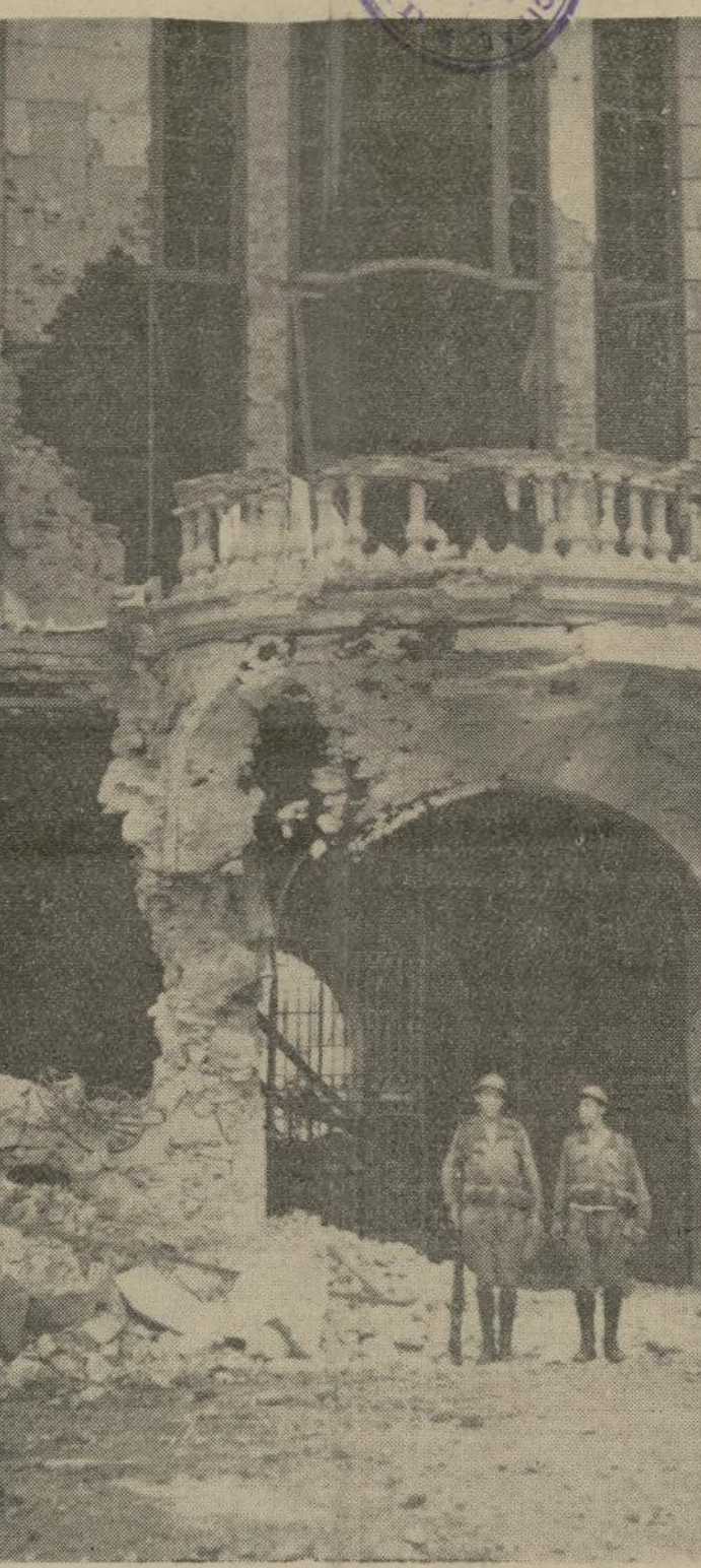
Cuartel del tercer regimiento de Infantería en Río de Janeiro, después del bombardeo por la artillería de las fuerzas leales durante el estallido revolucionario que estaba planeado como una revuelta comunista general en todo el país.