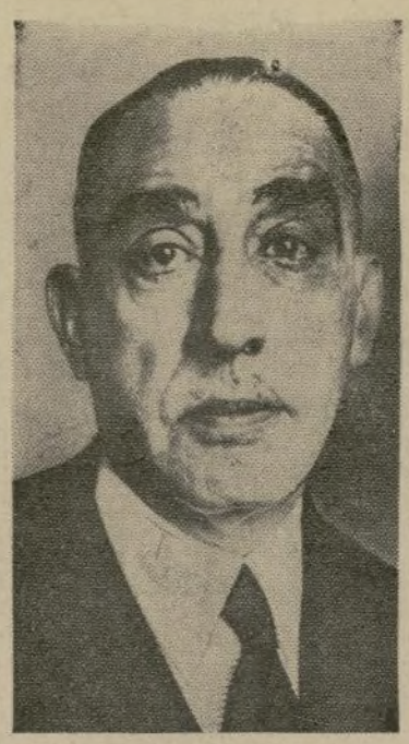
D. José Martínez de Velasco, jefe agrario y encargado de formar nuevo gobierno.