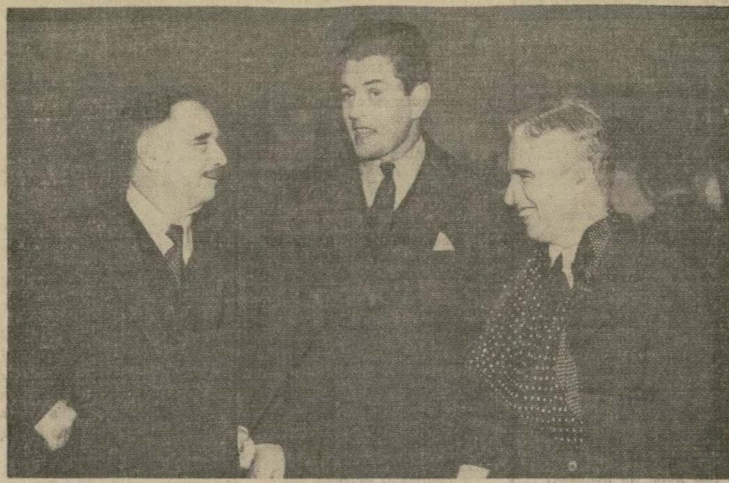
H. G. Wells, famoso novelista británico (izquierda), invitado de honor en un "cocktail party" dado en Hollywood por Charlie Chaplin (devecha), conversa con éste y con Gene Tunney, ex-campeón de peso completo. El escritor es huésped de Chaplin durante su permanencia en el sur de California.

FIGURAS CÉLEBRES EN LA LITERATURA, BOXEO Y CINE