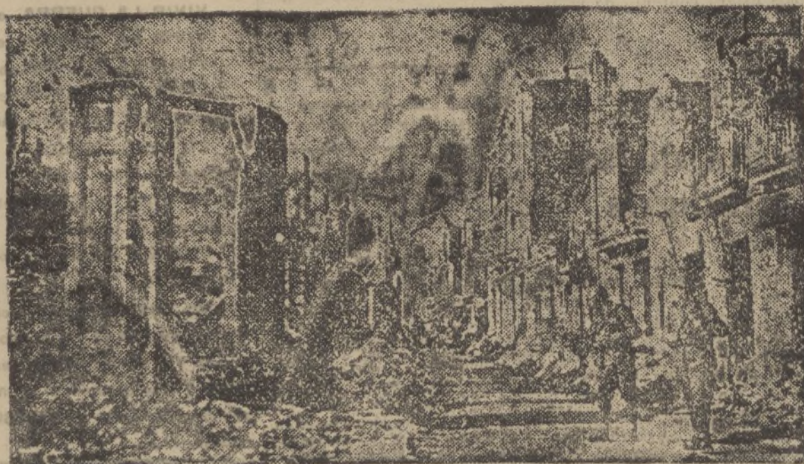
He aquí una visión dantesca de Guernica, la mártir, víctima de los rojos y de sus hermanos en el crimen, los separatistas vascos