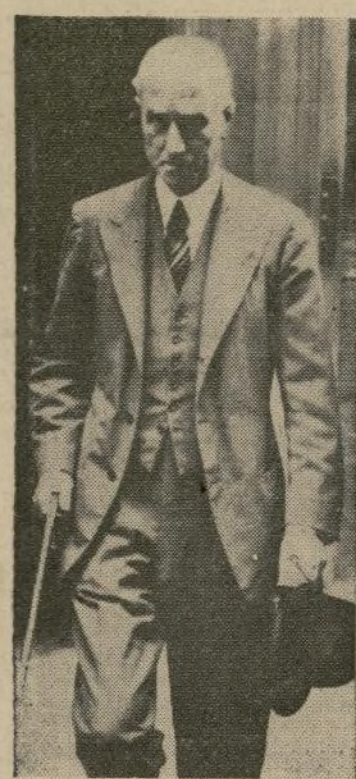
Sir Samuel Hoare

de 500 abisinios muertos en contraataque con tanques, aviones y artillería.—Las bajas italianas ascendieron a 272.—Ras Imeru quería reconquistar Aksum.—Batallas de horas a bayoneta calada.—Treinta mil africanos tomaron parte en la acción.