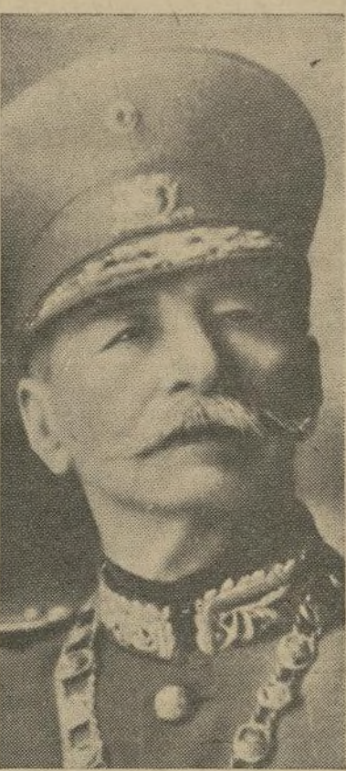
Gen. Juan Vicente Gómez

Cañonazos a cada media hora en señal de duelo.—Millares de automóviles en peregrinación hacia el lugar del fallecimiento.—Gran afluencia de noticias en todo el país.—Un enérgico manifiesto del presidente interino.