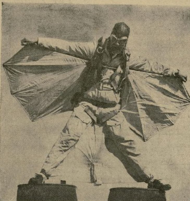
Clem Sohn, experto en paracaidismo retardado, que se lanzó desde un avión a 10,000 pies de altura durante las recientes maniobras aéreas en Miami y aterrizó con toda felicidad después de abrir su paracaídas a solo 1,000 del suelo.