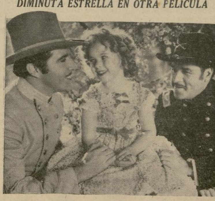
Shirley Temple, la aplaudida estrella de la pantalla quien toma parte, en calidad de protagonista, en la película "The Littlest Rebel" la cual está ahora en la pantalla del Radio City Music Hall. Acompañan a Shirley Temple John Boles y Jack Holt,