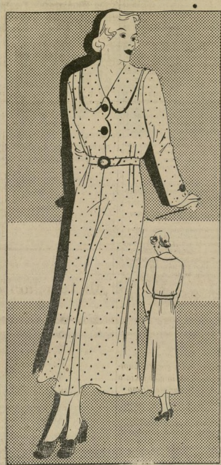
ELEGANTE VESTIDO DE CASA

1741-B—El hallar un vestido de casa confortable es tarea algo difícil. Hay damas que creen que un vestido de casa se compone con un lacito aquí y un volante allí, error grande, ya que un vestido de casa no se compone con detalles femeninos solamente. La mayor parte de las señoras de casa le dan tanta importancia a los detalles como a una carrera profesional, y por lo tanto estas prefieren que los vestidos que se usan para desempeñar los trabajos domésticos sean confeccionados con ese fin en consideración. El vestido del grabado es ideal, sencillo y de corte sumamente elegante. En la cintura se notarán unas pinzas que lo acentúan graciosamente a la figura, y la costura del frente alarga la silueta. Tiene bastante amplitud para que su dueña pueda ejercer las actividades domésticas confortablemente. El cuello del diseño es redondo y el cierre de la blusa tiene ondas que están acentuadas