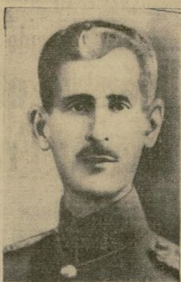
General Eleazar López Contreras, ex-ministro de Guerra y Marina, que fue elegido por el gabinete provisional después de la muerte del presidente Juan Vicente Gómez, que había sido dictador del país durante 27 años.