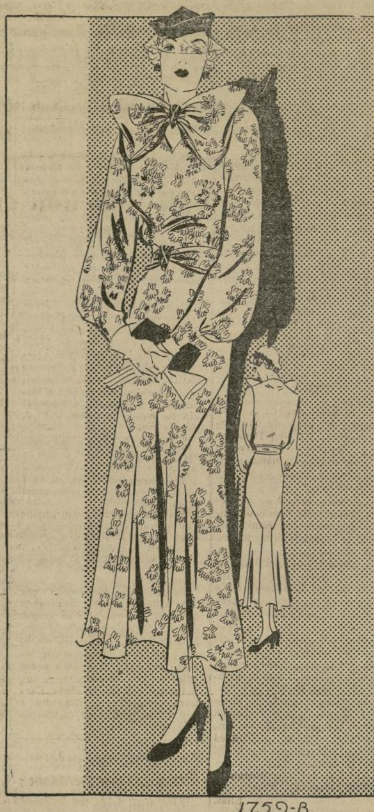
ELEGANTE MODELO CON LAZO ATRACTIVO

1759-B—Esta temporada predominan los vestidos de estilo femenino, por cuyo motivo se usan mucho los lazos. El gran modisto Vionnet los usa en los vestidos de última novedad. Los hay de distintas formas, así como también los hay de piedras de fantasía para usar en los vestidos de noche. Los lazos hechos de tela se apropian para los vestidos sencillos. El lazo enorme que luce el traje que ilustramos consiste en el único adorno, ya que el resto del vestido está completamente sencillo. Las mangas tienen un fruncido gracioso cerca del puño, y la blusa tiene un escote V muy tentador. La falda se entalla graciosamente sobre las caderas y también tiene un panel en cada lado que se amplía hacia el ruedo. Existe mucho entusiasmo por las nuevas telas de rayón. Las hay con diseños impresos y en colores sólidos.