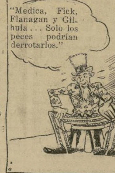
Medica, Fick, Flanagan y Gilhula... Solo los peces podrían derrotarlos.

"Comes the Revolution": "Mr. Gallico: "Es de pensar que un reporter deportivo es por lo menos un "sportsman", pero su artículo "Comes the Revolution", publicado el 21 del actual, demuestra que usted es todo menos eso.