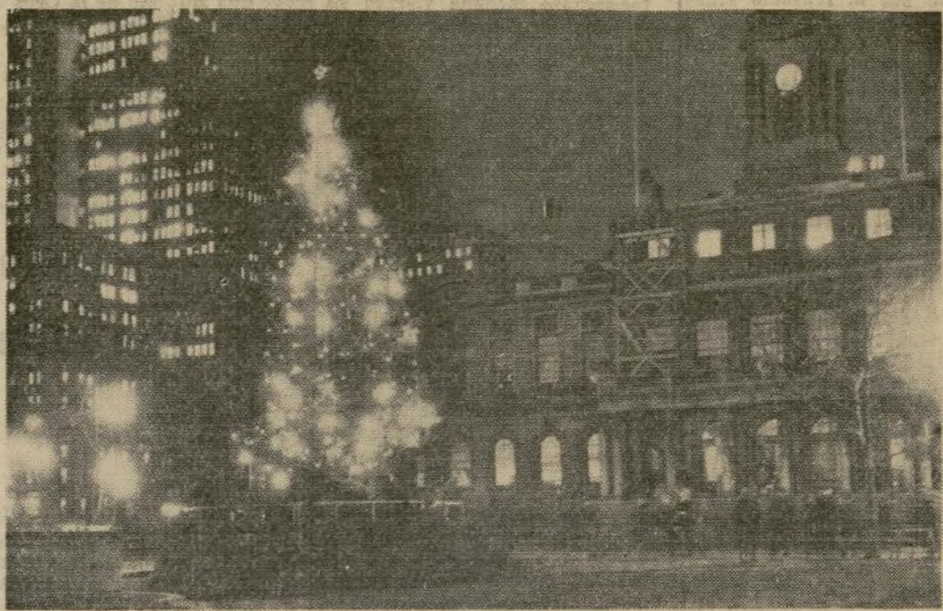
Gigantesco árbol de Navidad frente al municipio de Nueva York en la plaza rodeada de rascacielos del distrito comercial. Otros veintidós árboles han sido colocados en parques de los cinco distritos de la ciudad.