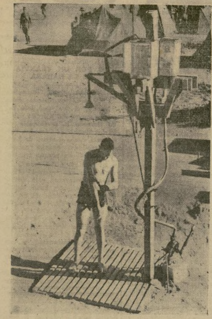
Un soldado italiano toma una ducha fría cerca de unos de los campamentos de concentración en donde casi no existe el agua y tiene que ser traída desde pozos situados a muchas millas de distancia.