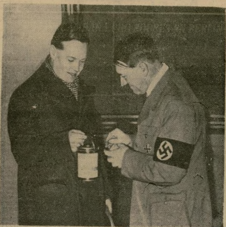
Hitler entrega su donación para los desvalidos de la ciudad durante los meses de invierno, al empezar la campaña para reunir fondos.