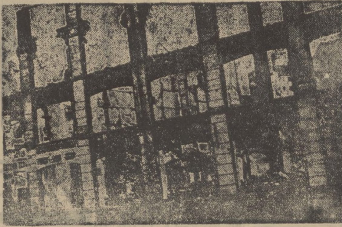
Un aspecto de Eibar, la industriosa y próspera ciudad bilbaína, convertida en escombros por la furia destructora de las hordas rojo-separatistas vascos