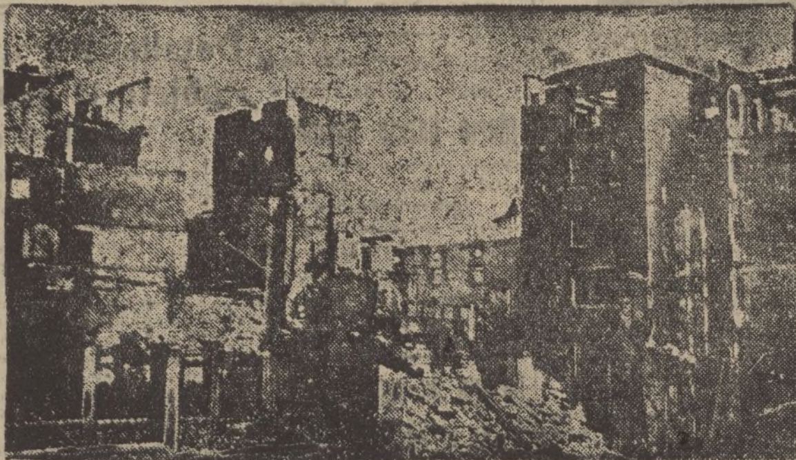
Otro aspecto de la mutilada ciudad eibarresa