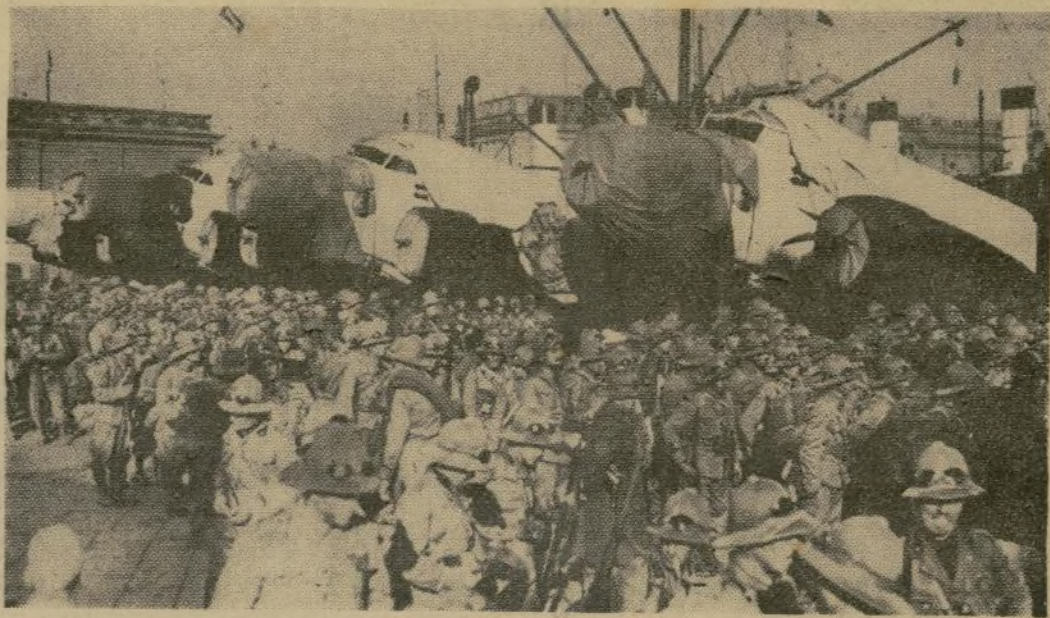
La división "Tiber," compuesta de voluntarios, los cuales regresaron a Italia de países extranjeros, se embarca en Nápoles para ir a pelear en Etiopía. En el fondo se ve un grupo de aviones de bombardeo listos para ser embarcados para el frente.