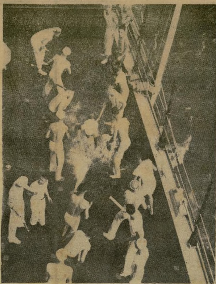
Marineros de un crucero estadounidense baquetean y dan gran ducado a los nuevos miembros de la tripulación del barco al cruzar la línea ecuatorial, de acuerdo con la antigua tradición del mar que observan los marineros de los barcos de guerra y mercantes.