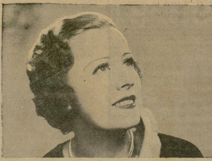
Irene Dunne, protagonista de la película "Magnificent Obsession" que exhibe el Radio City Music Hall. Esta es una película que ha sido muy aplaudida por la crítica.