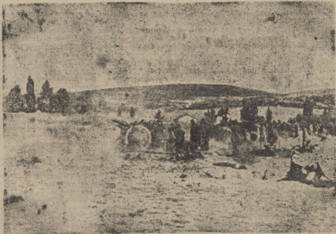
UNA DE NUESTRAS BATERIAS EN ACCIÓN