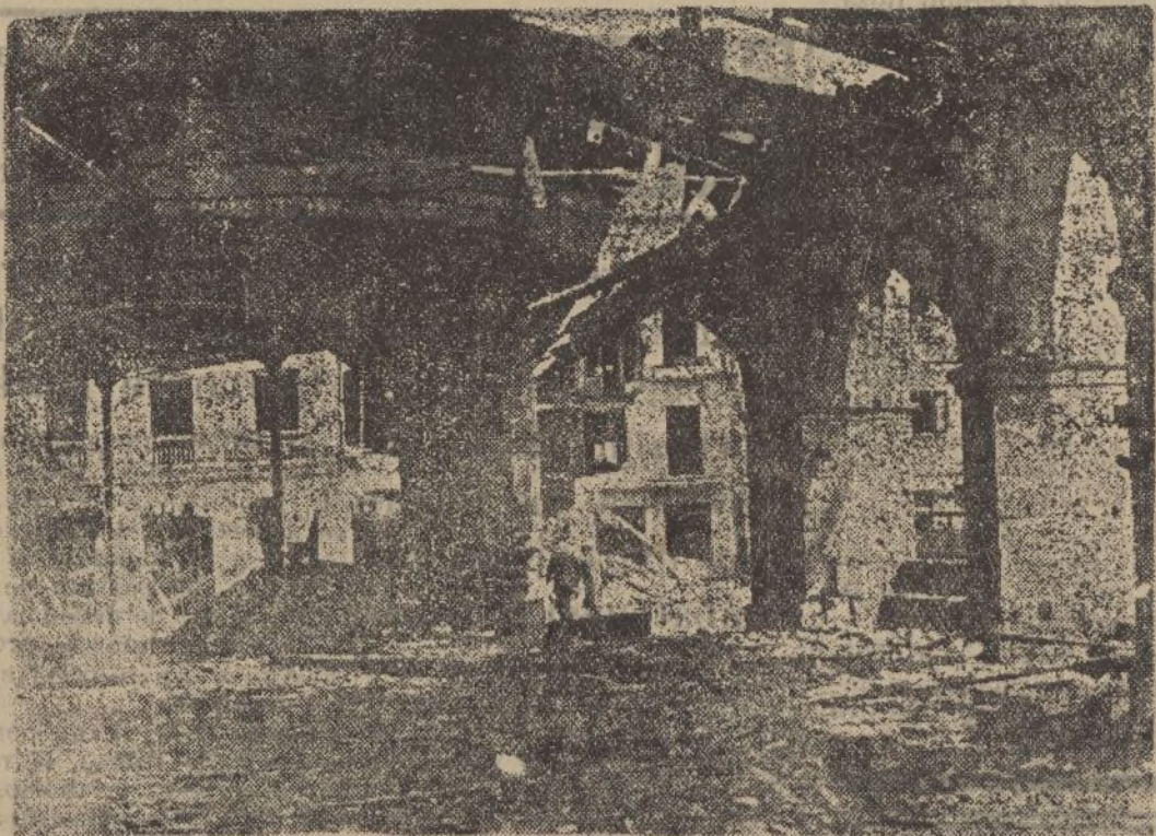
Una casa de Guernica después de incendiada por los rojos y separatistas vascos

Corpus Christi: Annabella en «Un hijo en América» y la formidable película de acción, «Por nevadas sendas».