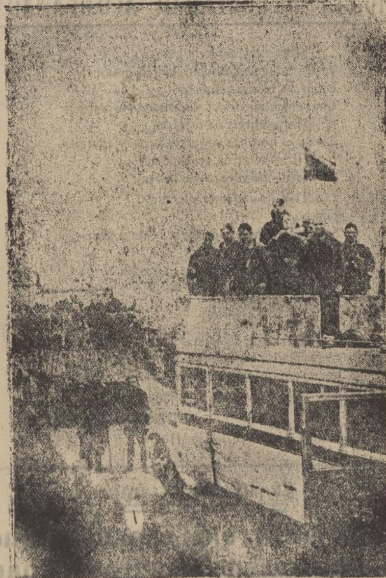
Fuerzas motorizadas nacionales que avanzaban sobre Bermeo, hoy ya en poder de nuestras tropas