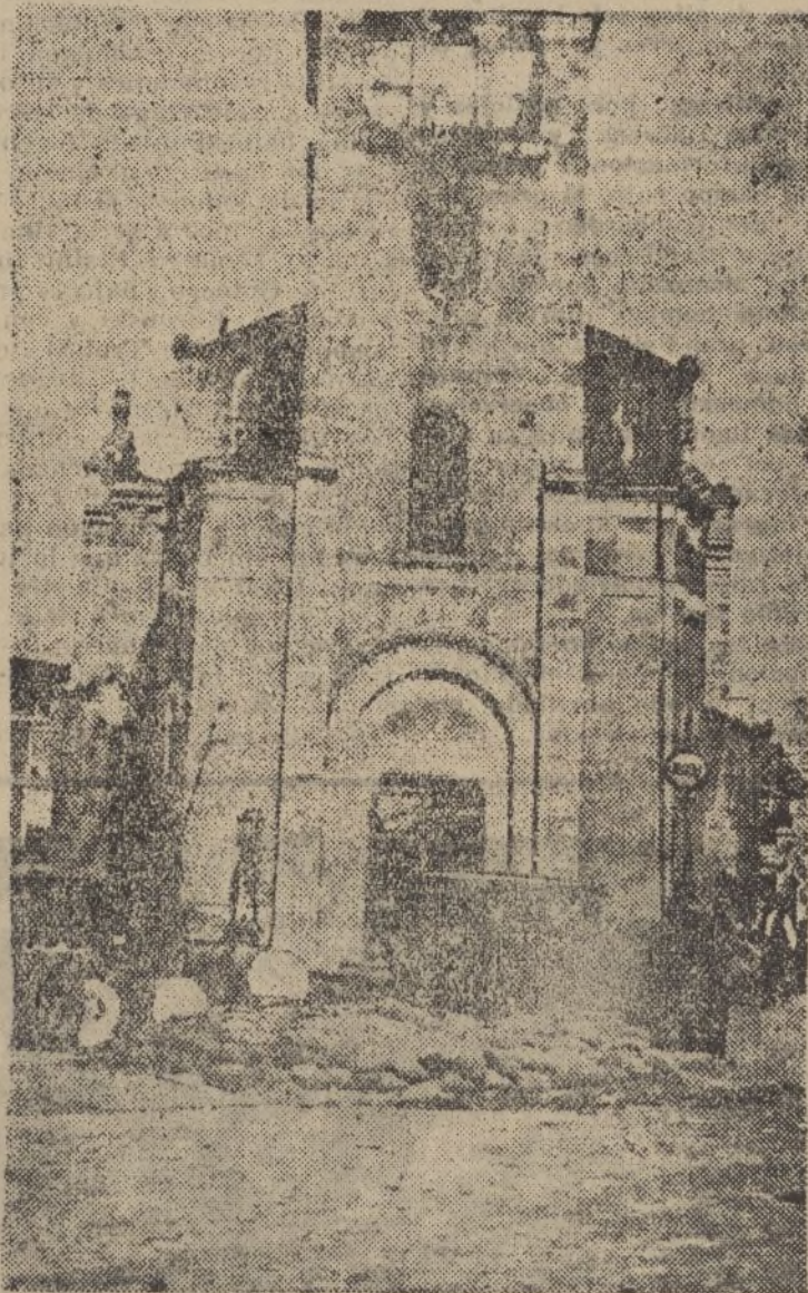
Una iglesia de Guernica quemada por ateos marxistas, con la anuencia de los «católicos separatistas vascos»