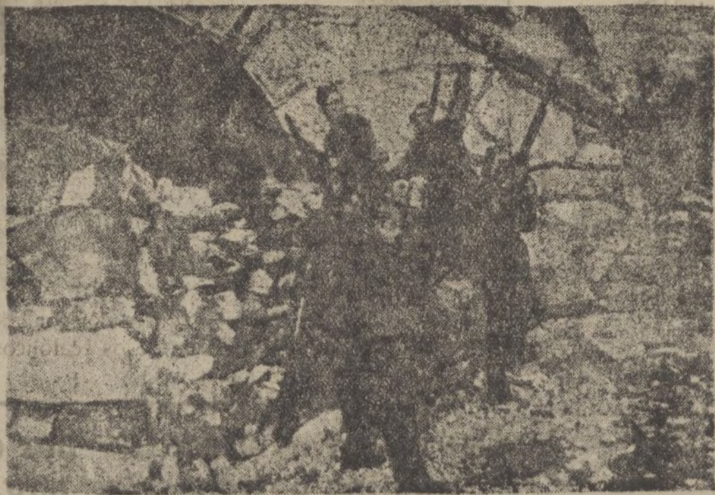
TIROTEANDO UN AVIÓN ROJO

X LEA VD. X TODAS LAS MAÑANAS X DIARIO DE HUELVA