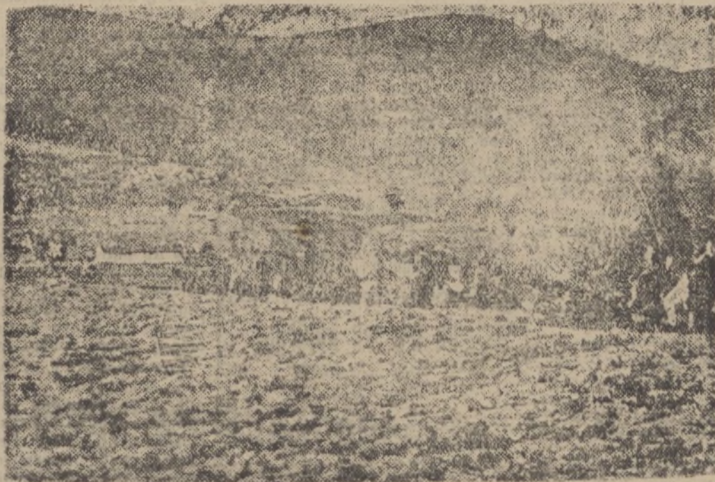
Las baterías nacionales emplazadas en alturas casi inaccesibles del frente vasco

La impresión que se tiene acerca de esta maniobra de Delbos es que ha fracasado apenas nacida, ya que el Caudillo de la España nacional, Generalísimo Franco, mantiene la única posición digna, a saber: seguir luchando hasta alcanzar la victoria definitiva y extirpar del suelo español todas las raíces del comunismo.