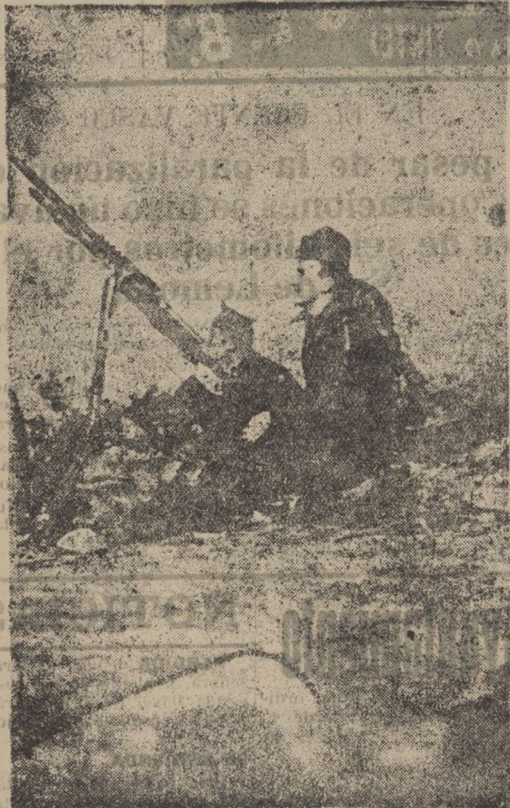
Nuestros valientes soldados haciendo fuego sobre un avión rojo.

Nuestros soldados y milicias aguantan de los frentes las penalidades de la campaña.—Vosotros, los que estais en retaguardia, mirad por ellos todo cuanto os sea posible, aunque sacrifiqueis un poco de vuestras comodidades y satisfacciones.