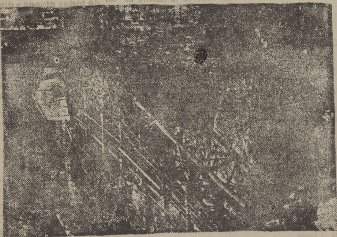
El puente de Maizaga, entre Eibar y Durango, volado por los rojos para impedir lo inevitable: el avance seguro y victorioso de Ejército de Mola