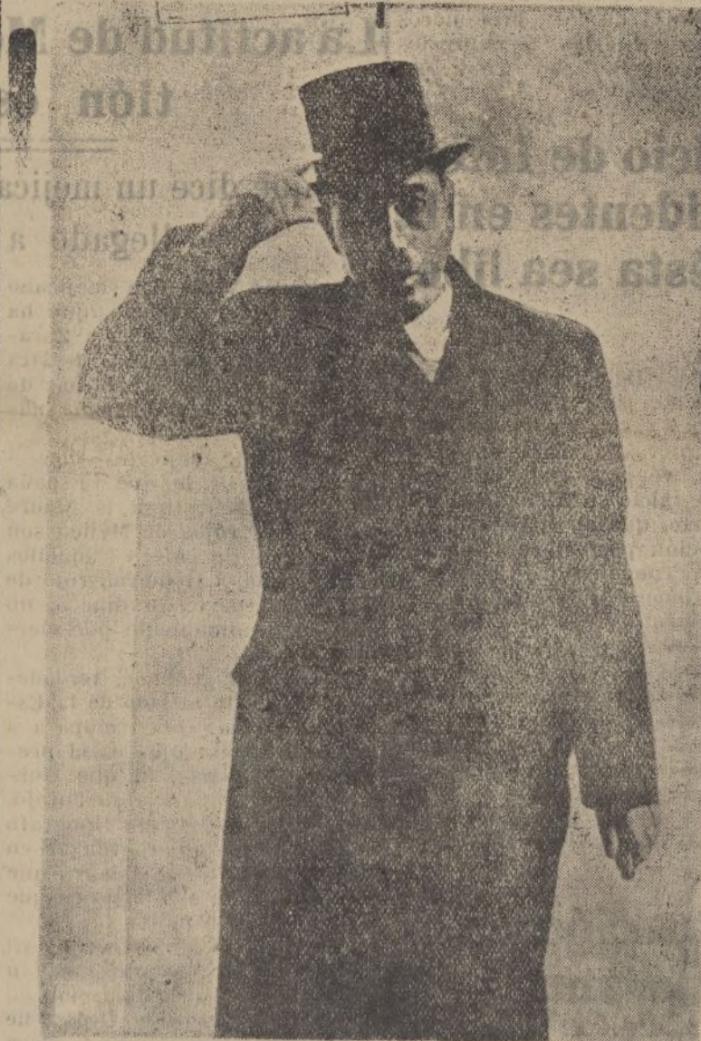
El jefe del Gobierno belga, Van Zeeland

TENERIFE, 29. —Telegráficamente informan desde Roma que Mussolini ha declarado: «No pienso tomar en cuenta el «Libro Blanco» que Valencia ha llevado a Ginebra».