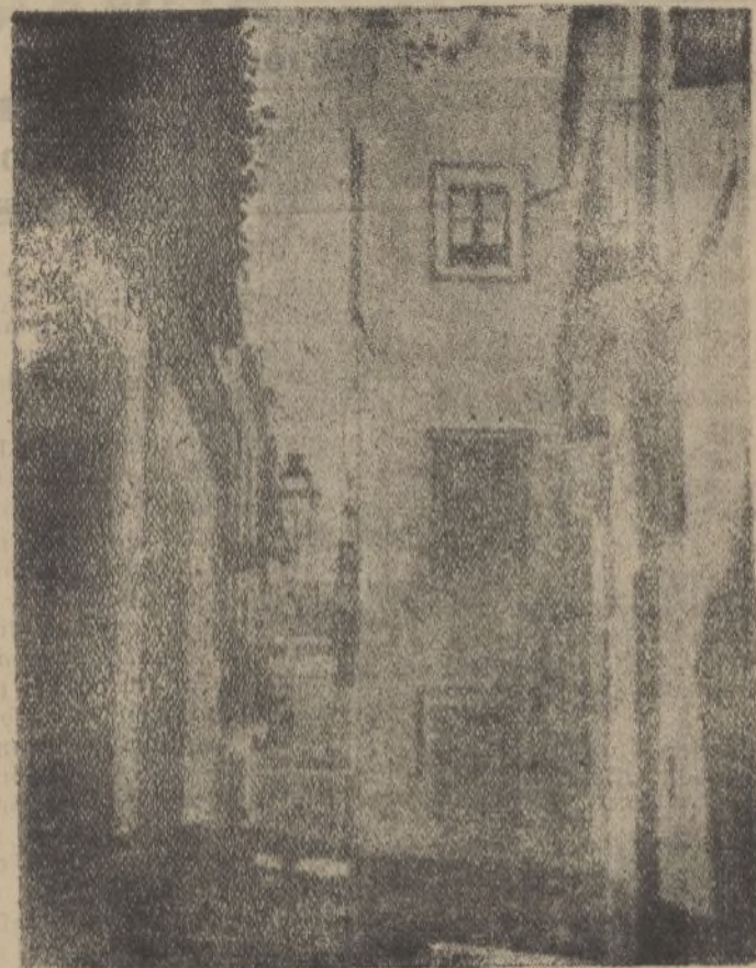
* SEVILLA.—Una calle de Triana.