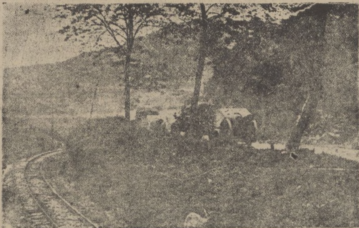
Estampas del frente de Vizcaya