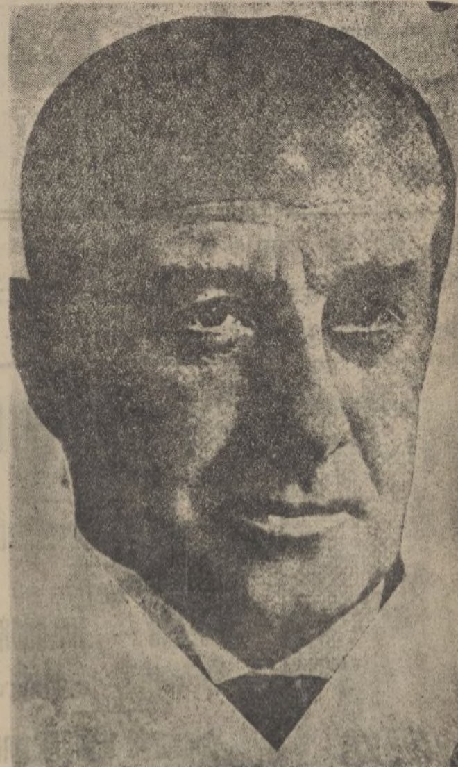
Sir Baldwin, jefe del Gobierno inglés recientemente dimitido y a quien el Rey Jorge VI le ha colmado de honor en premio a sus valiosos servicios a la nación británica

salvaguardó, me la santificó y me la reserva. Otra poesía, que no la digo, la siento junto a los mármoles de la Necrópolis, dedicada a los que murieron en paz y en esta guerra por la causa noble que defendemos, ansiando volver a sus pueblecitos y ciudades, para besar a sus madres después de haber besado a su madre Patria. Otra poesía, para levantar el espíritu religioso, sin el cual el pueblo