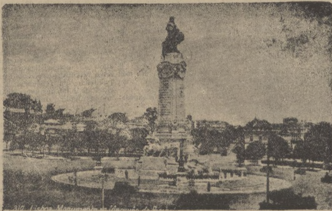
LISBOA.--Monumento al marqués de Pombal