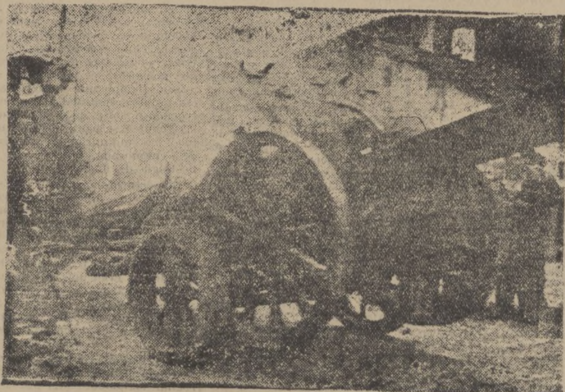
Estampas del frente de Vizcaya

Todos unidos como un solo hombre e inspirados en un espíritu patriótico único, la orden del Generalísimo Franco.