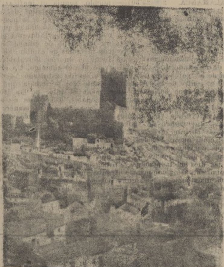
ALICANTE.—Castillo de Villena