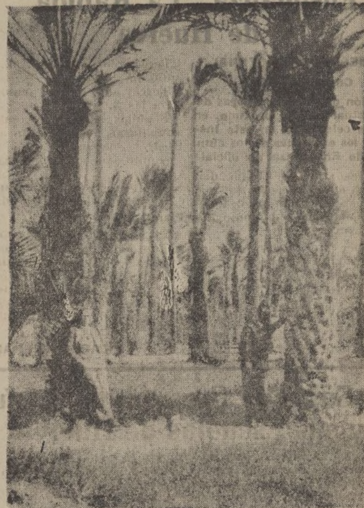
ELCHE.—Bosque de Palmeras

ventud nacional está dando su vida por el triunfo del espíritu y de la ley moral en el mundo. Inglaterra y Francia, pedazos vivos de Europa: ¡Abrid los ojos a esta verdad!