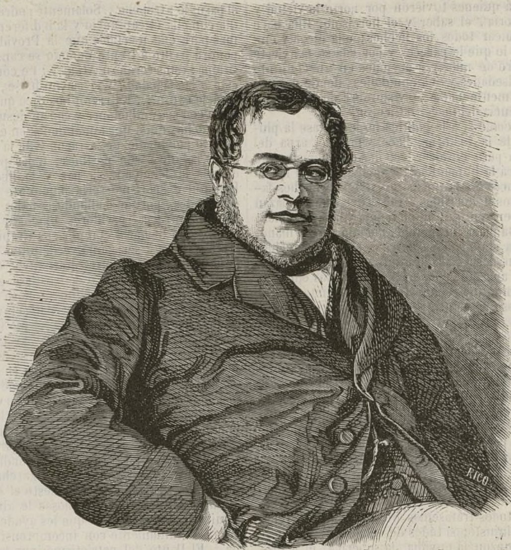
El conde de Cavour.