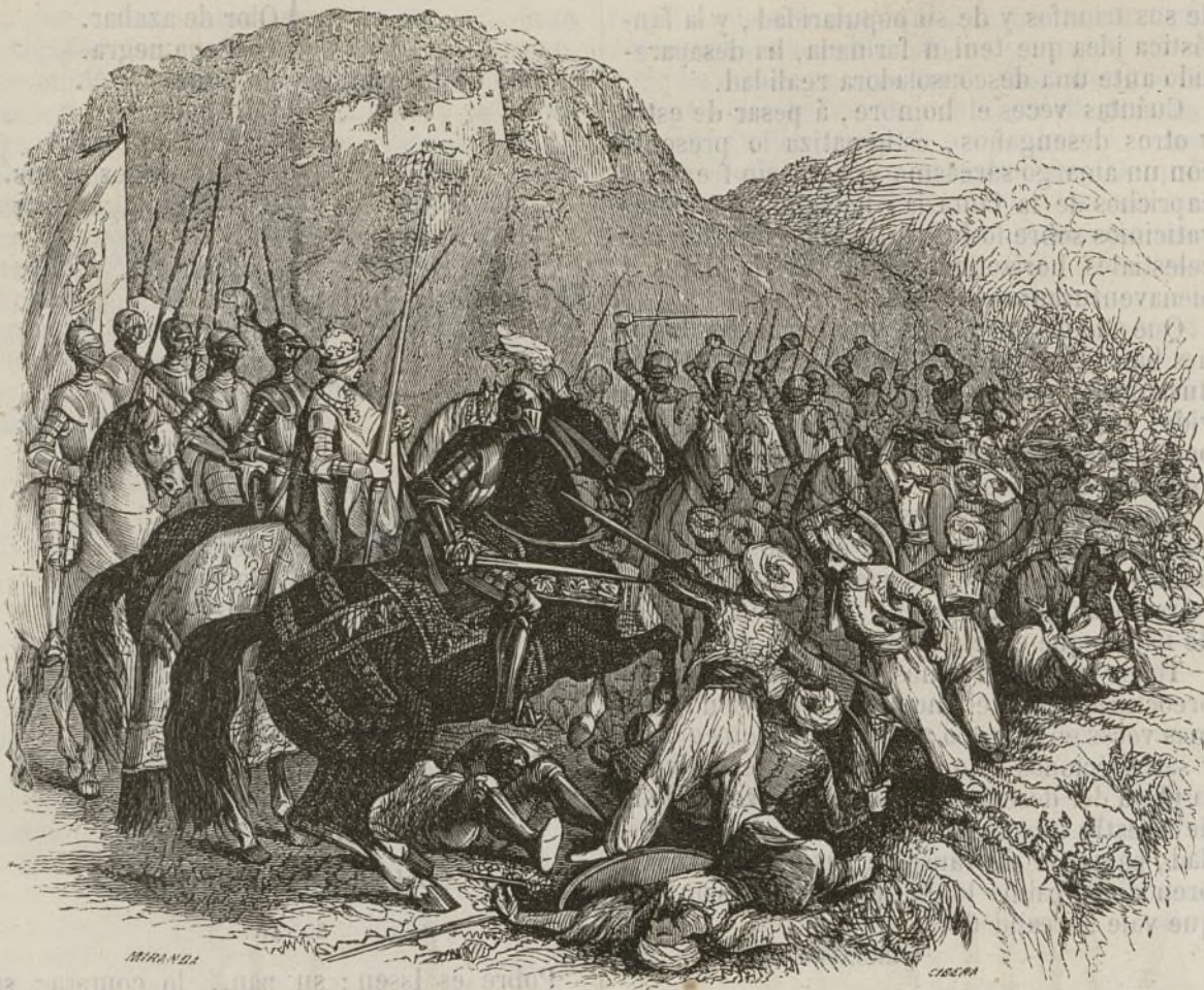
Batalla de las Alpujarras.