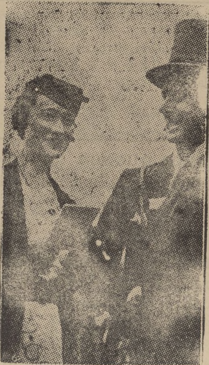
El duque de Windsor y Mrs. Wallis Warfield en una carrera de caballos, y que desde el día 3 del actual han quedado unidos por el sagrado lazo de un matrimonio de amor, signo feliz de una ventura interminable.

De Londres informan que la «London Gazette» publica una orden real, según la cual el duque de Windsor queda autorizado a usar los títulos y los atributos de Alteza Real. Estos títulos y atributos no son extensivos—declárase en dicha orden—a la esposa del duque ni a los hijos del matrimonio, si los tuvieran.