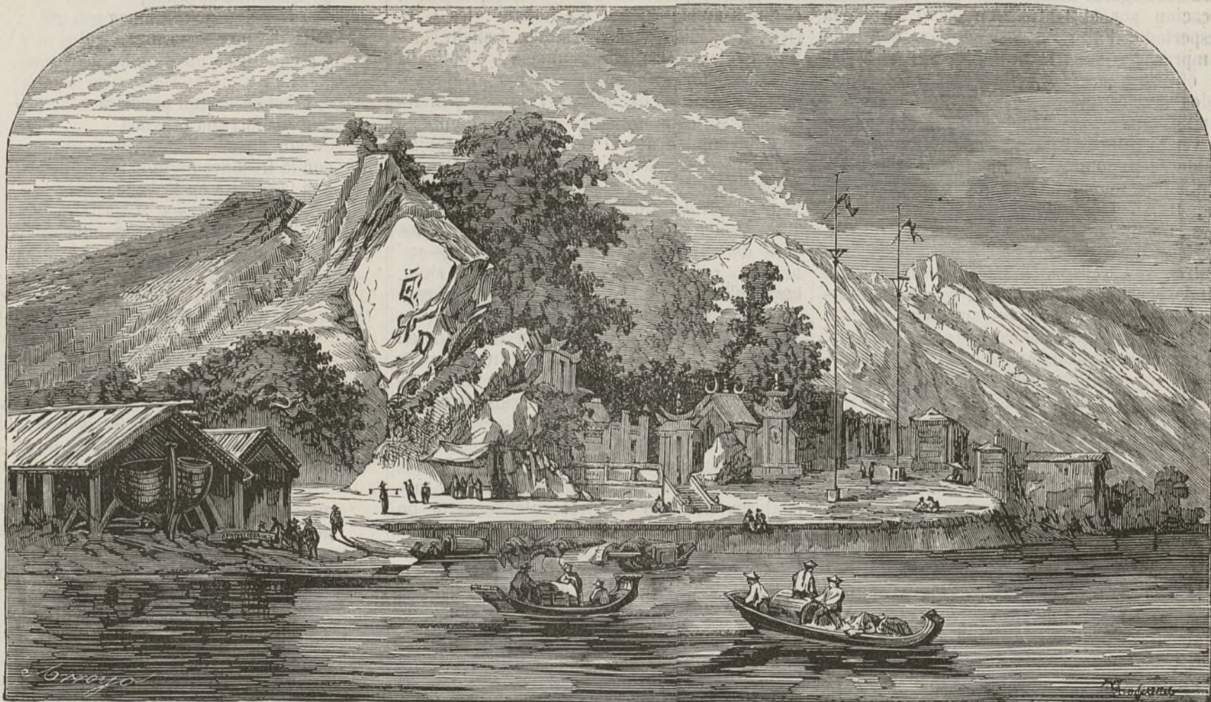
Pagoda de las rocas.

Don Juan II, rey de Castilla, fue hijo de Enrique III, y nació en 1405, y murió en 1454. Sucedió á su padre en 1406, bajo la tutela de su madre Catalina y de su tío Fernando. Habiendo sido este elegido rey de Aragon y muerto poco despues, así como la reina Catalina, continuó gobernando el mismo consejo que ésta tenia, y cuando el joven rey empuñó las