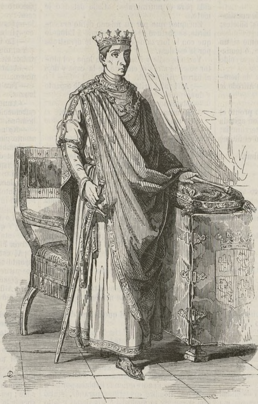
Don Juan II.

¿Y crees que es falta de carácter ó de energía? no, lector; pero si recoges tu espíritu y