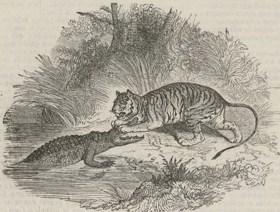
El tigre y el cocodrilo.

son castillos en el aire?» ¿Que es el amor para tí corto y liviano placer, y que á tu propia mujer pides virtud... porque sí? ¿Que cuando en trémulo cántico sobre mi dolor medito, arrojas mi pobre escrito y te enojo por romántico? ¿Que es opinion general en el mundano vaiven, si tienes dinero bien si falta dinero mal? ¿Y no es cierto, en conclusion, que con empeño irritado tú y todos habeis borrado la fe de mi corazon?... Pues entonces ¿por qué muda inclinas hoy la cabeza, cuando con noble franqueza nuestro la verdad desnuda? ¿Por qué tu pudor repara que á su afan no me acomodo, cuando te devuelvo el lodo que me arrojaste á la cara? Si la tuya enrojecida mi verdad desnuda vé, vístela, que yo no sé, ó dame mi fe perdida. Mas no esperes que el anhelo de tu hipocresía alabe: rompiste la pluma de ave que me remontaba al cielo, y en el mundano arsenal solo para hablarte he hallado, plumas de acero afilado fiel trasunto del puñal.