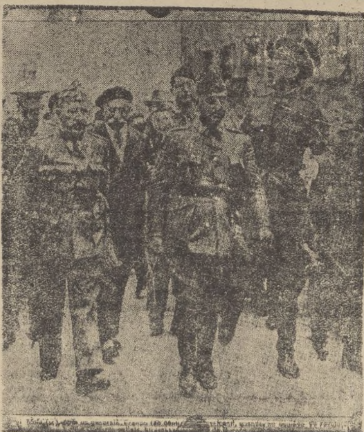
El malogrado general Mola (X) con los generales Franco y Cavalcanti, participando del júbilo con que se inició el movimiento nacional en la ciudad de Burgos