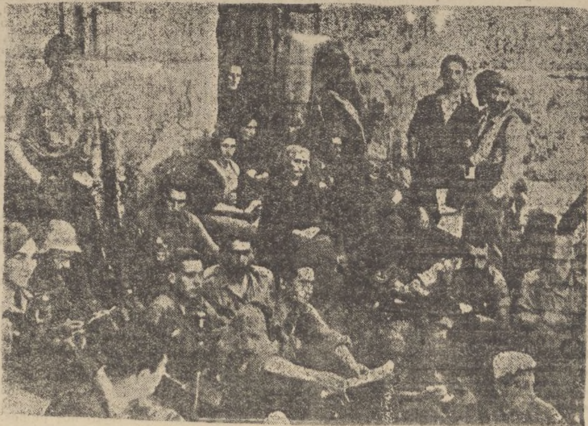
Los bravos requetés escuchan la voz de los caseros vascos durante el dominio rojo en las ciudades ultimamente conquistadas