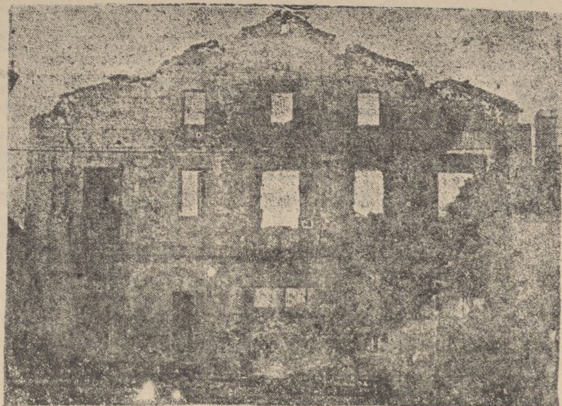
El paso de la horda rojo separatista por Amorabieta.