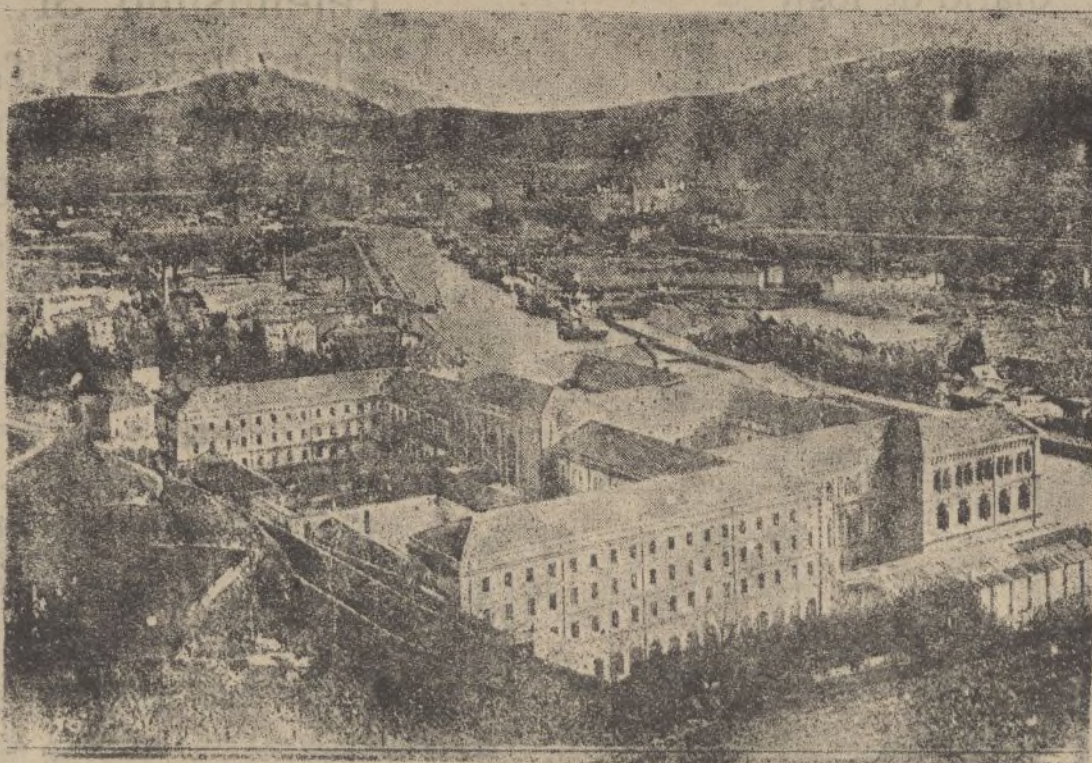
Deusto.—Vista de la Universidad y de las casas