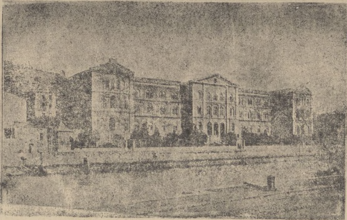
DEUSTO.—Fachada principal de la Universidad

FRENTE DE VITORIA, 16.-- La Radio-Durango informa que el «gobiernillo» de Euzkadi ha facilitado una nota oficiosa, en la que dice textualmente: «Los facciosos continúan su presión ofensiva sobre Bilbao y se hallan a unos cuatro kilómetros de la capital por su parte Este».