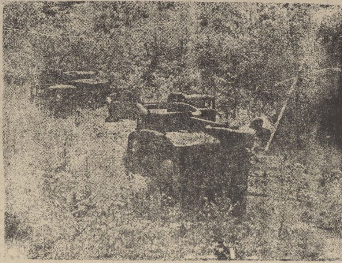
Cementerio de automóviles a las puertas de Lezama