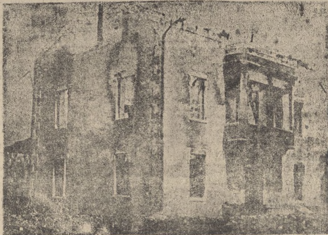
Un chalet de Am. rabieta, destruido por el fuego y la dinamita de los rojos separatistas