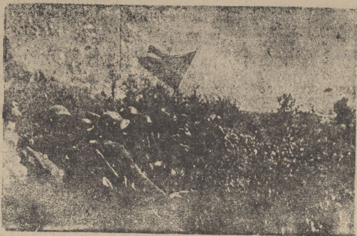
Esperando la orden de avanzar con la gloriosa bandera bicolor que agita el aire