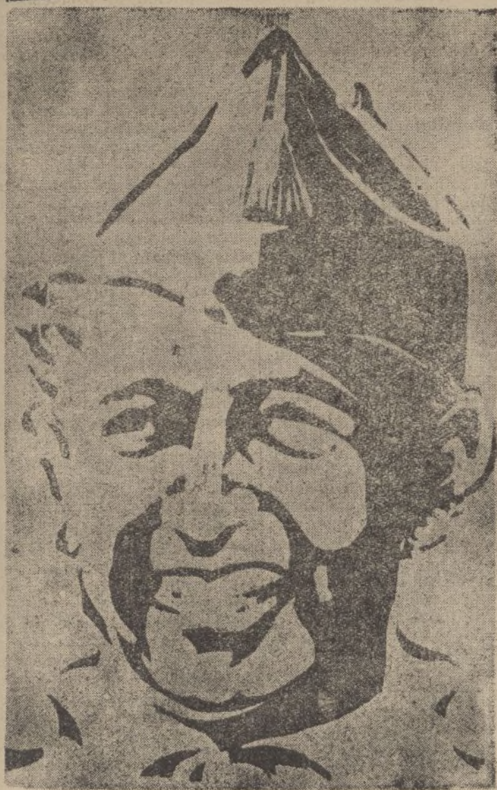
El Caudillo Nacional

El Generalísimo Franco, invicto Caudillo, bajo cuyo mando supremo los Ejércitos nacionales marchan seguros y alegres a la victoria definitiva del ansia española.