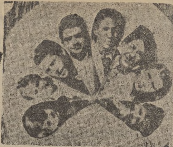
Con motivo del segundo aniversario de la fundación de la «E. T. I. A.», éste ramillete de pequeños fundadores, en unión de otros, llevará a la escena en una noche azul del próximo mes de Julio, la preciosa comedia dramática de los Hermanos Quintero, que lleva por título: MALVALOCA, en honor y homenaje de dichos plumas.

Heroicos hermanos heridos que por nosotros habéis vertido, sin escatimarla, vuestra sangre juvenil. Esforzados campeones que manteneis en el frente el fuego sagrado que anima el Movimiento Nacional. Soldados de España, invictos arietes del marxismo, nosotros, la retaguardia recoge vuestra sangre como preciosa reliquia que lleva su corazón, para devolvéroslo en efusiones de cariño, ya que solo así podemos participar en vuestra gloria.