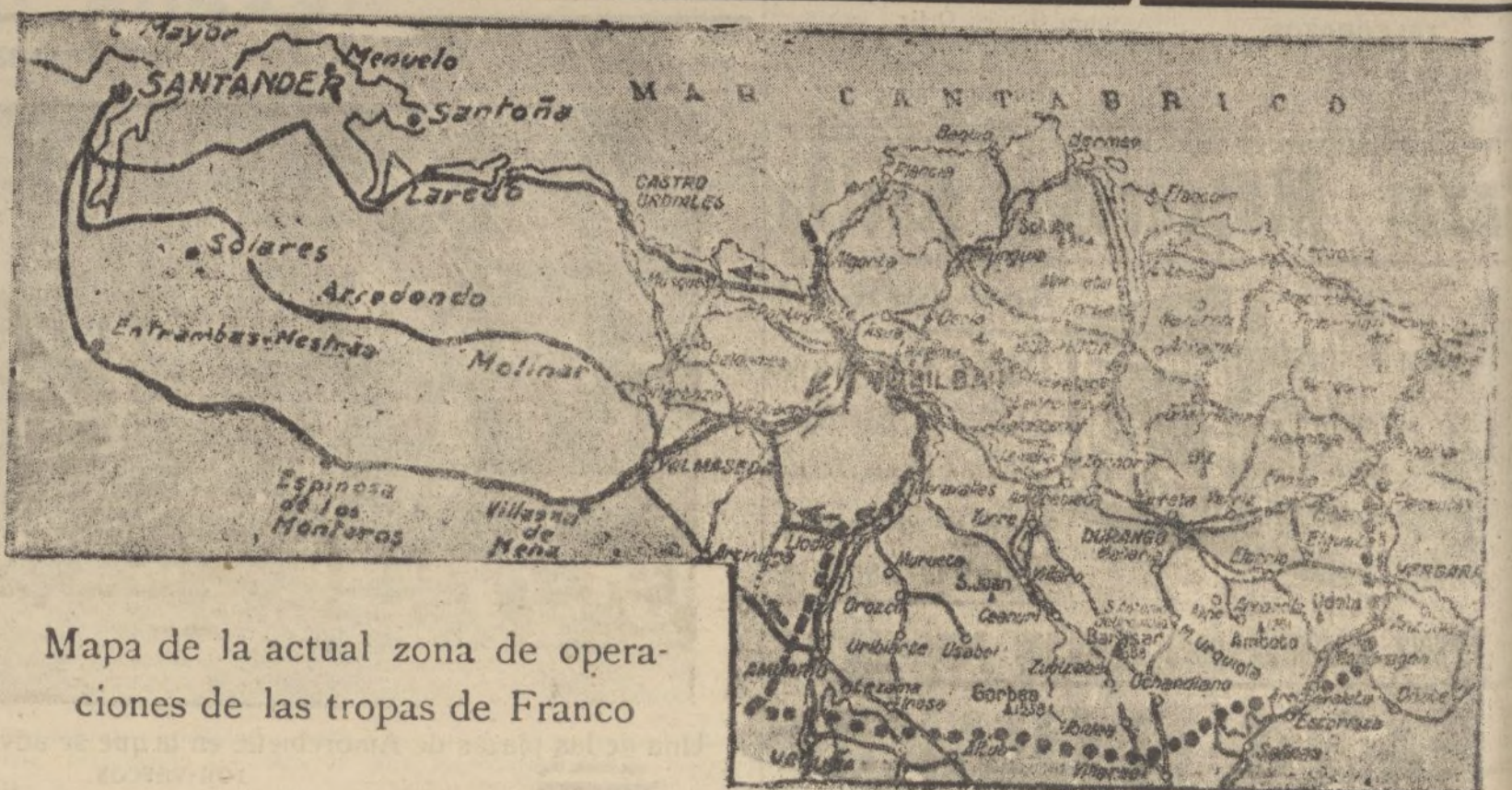
Mapa de la actual zona de operaciones de las tropas de Franco

del Generalísimo Franco Jefe del Estado Español Tamaño 50 x 35 Precios 0'75 ptas. DIARIO DE HUELVA