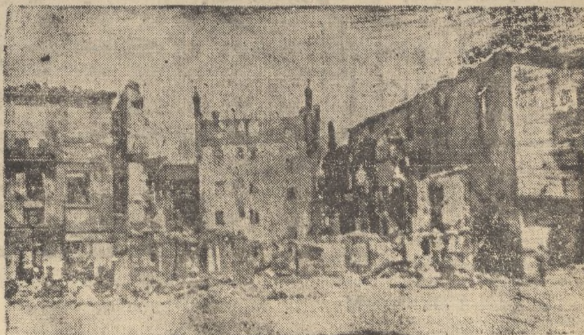
Una de las plazas de Amorebieta, en la que se advierte la saña bestial de los roji-vascos