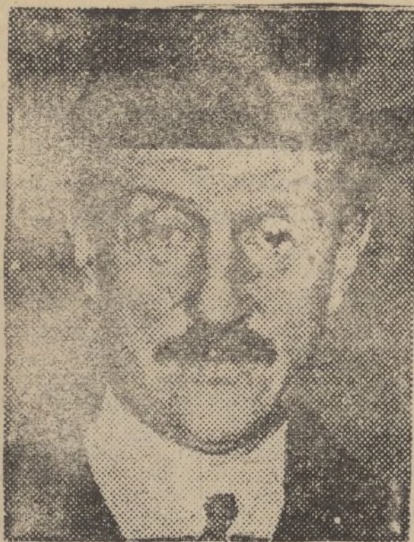
Camilo Chautemps, que acaba de formar el nuevo Gobierno de la República Francesa.

quirúrgico y cuarto de vender (le adjunto un pequeño croquis para que se haga cargo de ello, presupuesto y memoria) y la construcción de todos y adquisición del instrumental, según presupuestos formulados por el señor Arquitecto y las casas vendedoras, es de cien mil pesetas.