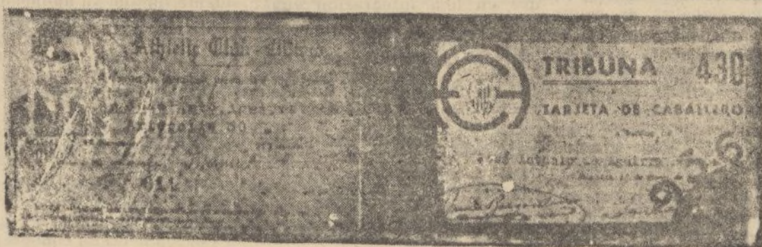
Interesante fotografía del carnet de socio del Atlético de Bilbao, del llamado presidente de la República de Euzkadi, Aguirre, obtenida en su casa de Las Arenas.