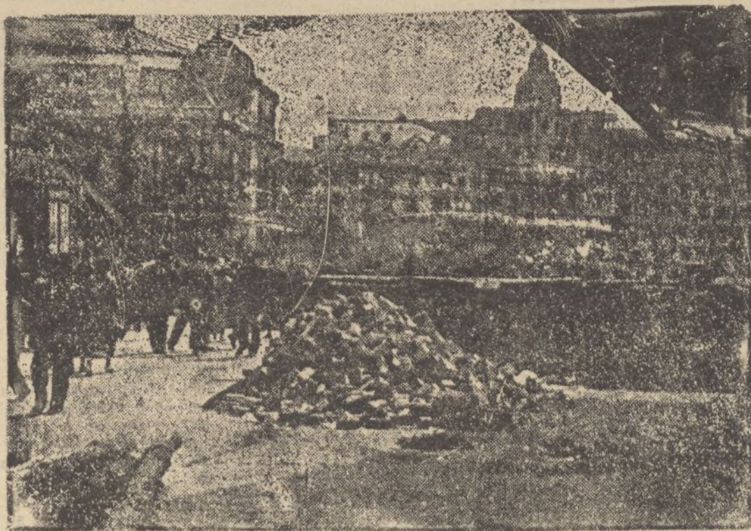
Barricada en la Gran Vía de Bilbao, ante el puente de Isabel II, volado con dinamita por los rojos