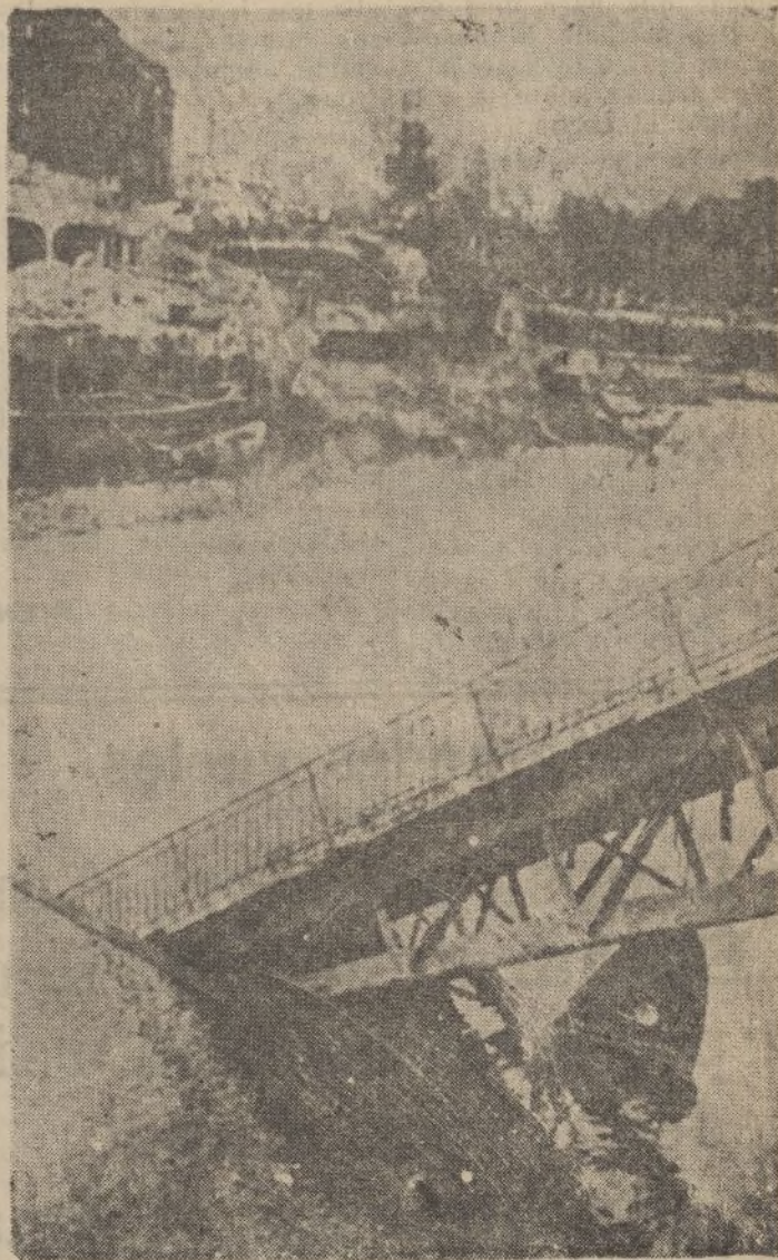
La pasarela del puente Isabel II hundido en las aguas