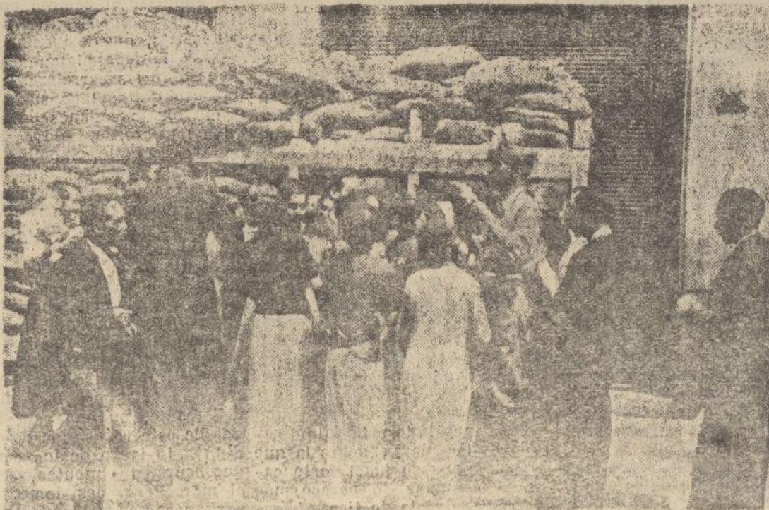
Nuestro Ejército repartiendo viveres a la población hambrienta