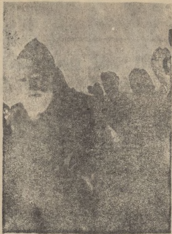
Una visita del general Cabanellas al frente de Bilbao