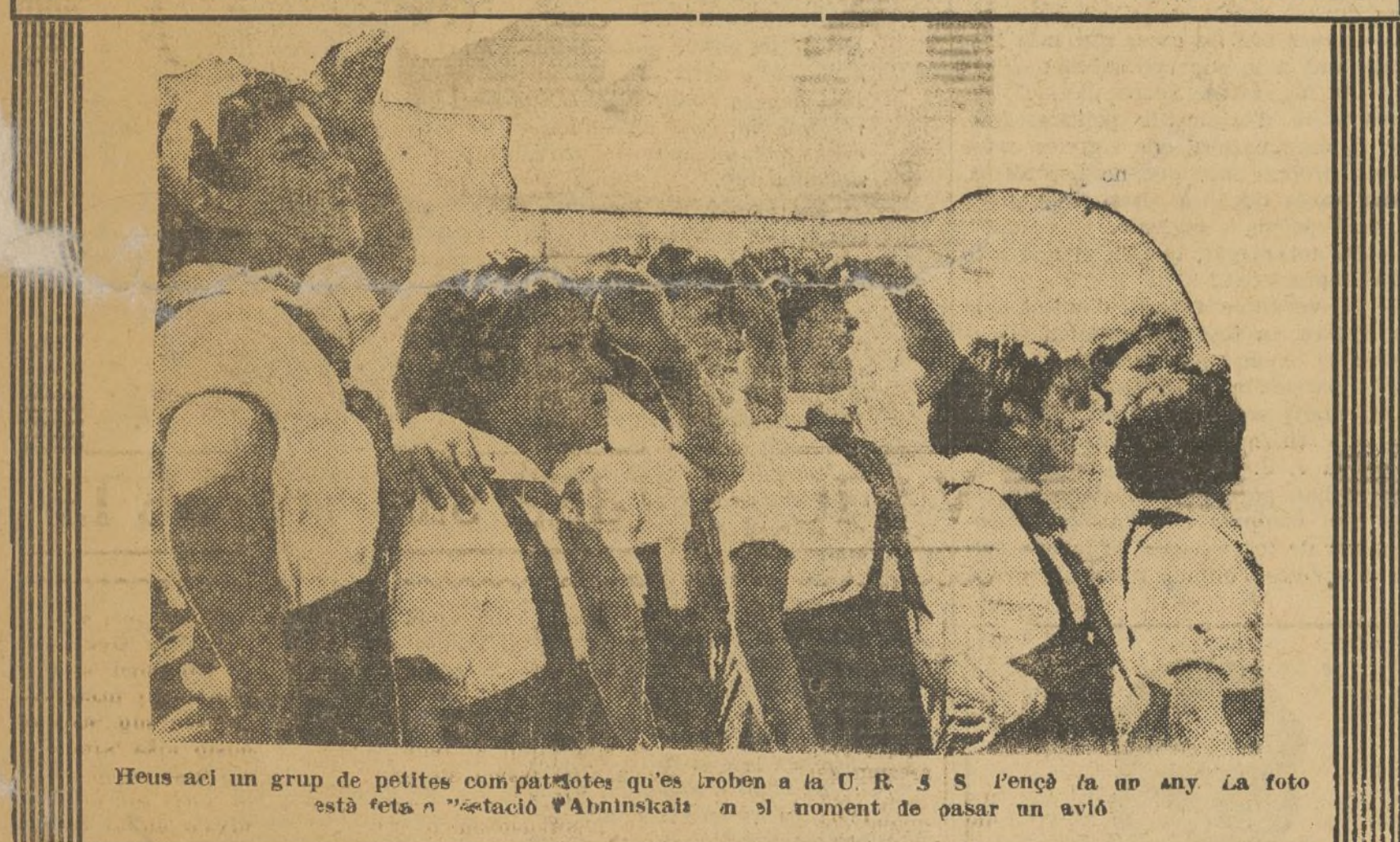
Heus ací un grup de petites com patotes que's troben a la U. R. S. S. l'engé fa un any. La foto està feta a l'estació d'Abinskaisk al moment de passar un avió