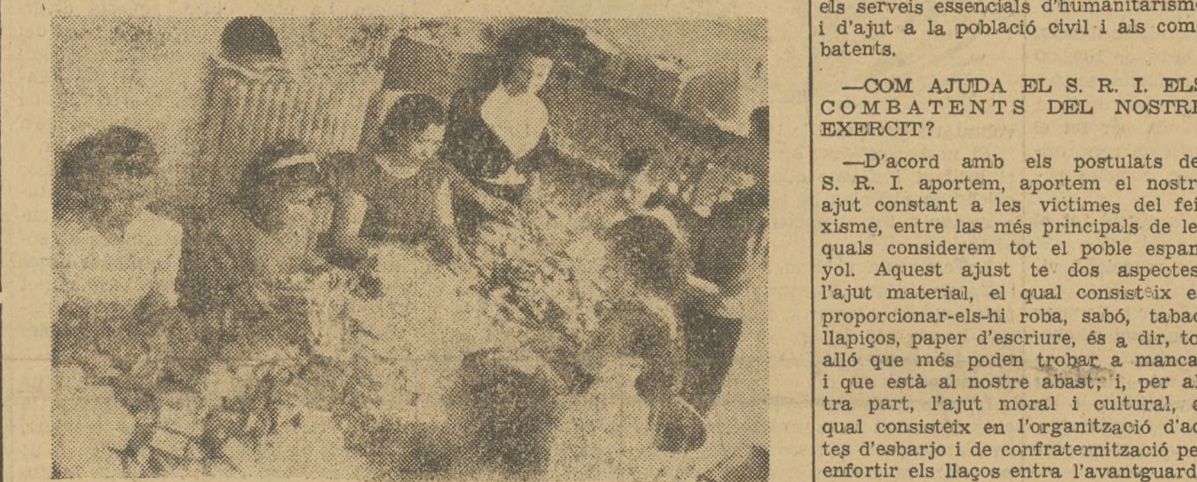
Les noies del S. R. I. preparant un donatiu pels soldats

Resultat d'aquest treball, fou que quan l'Exèrcit va començar a organitzar-se com a tal, es troba amb una sanitat constituïda, la qual el S. R. I. va cedir desseguida a les autoritats supremes de l'Estat pel seu perfeccionament. També va començar a organitzar la distribució metòdica dels queviures destinats als combatents, centralitzant a Madrid un aparell que va servir de base per a l'actual Intendència de l'Exèrcit Popular, i el qual va cedir igualment als organismes estatals. Quan el feixisme s'apropava a la capital de la República i era indispensable l'evacuació de la població no