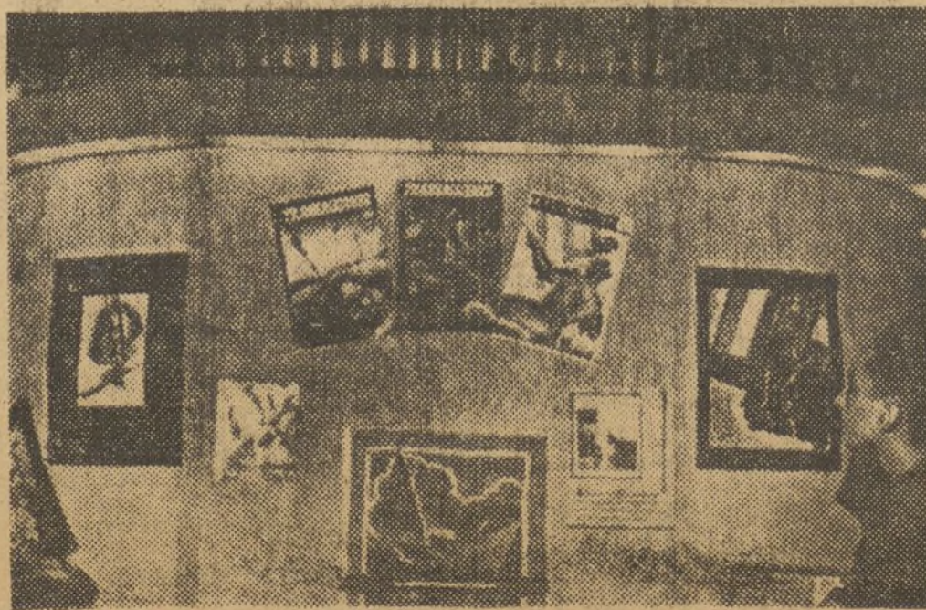
Un dels stands que figures a l'Exposició.