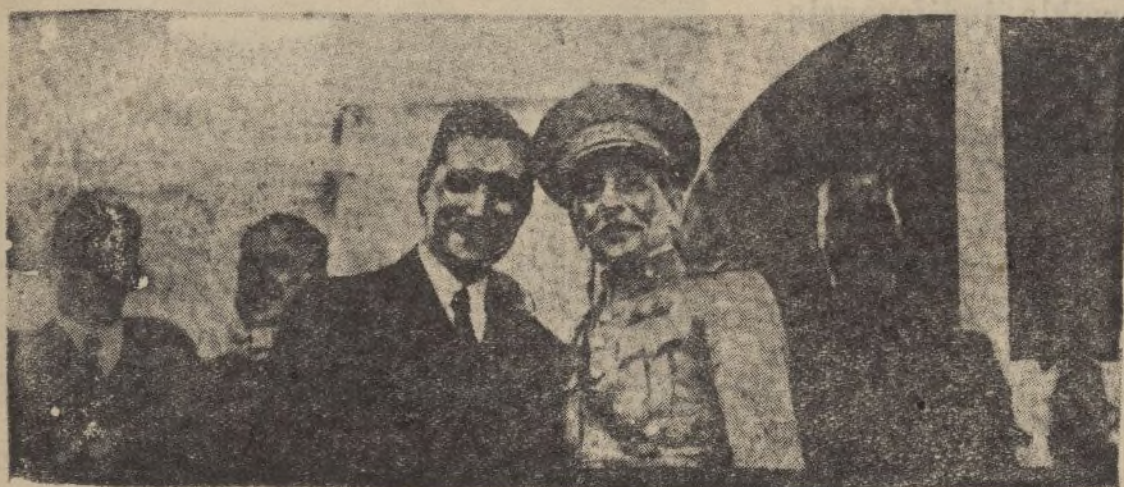
El Jefe del Estado, general Carmona y el Presidente Oliveira Salazar, presenciando el desfile magnífico de la «Mocidade Portuguesa», sonríen complacido ante las fervorosas aclamaciones de la multitud