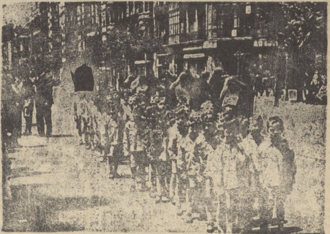
Los niños del Asilo de «Comillas», acompañados de hermanas de la Caridad, pasean tranquilamente por la población, ya totalmente ocupada por nuestras tropas