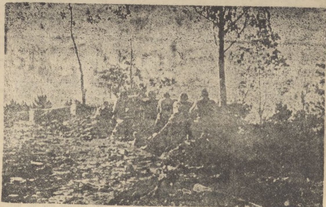
Una batería nacional actuando en la primera línea fortificada de Bilbao.

España grande, próspera y feliz con el sacrificio de todos.