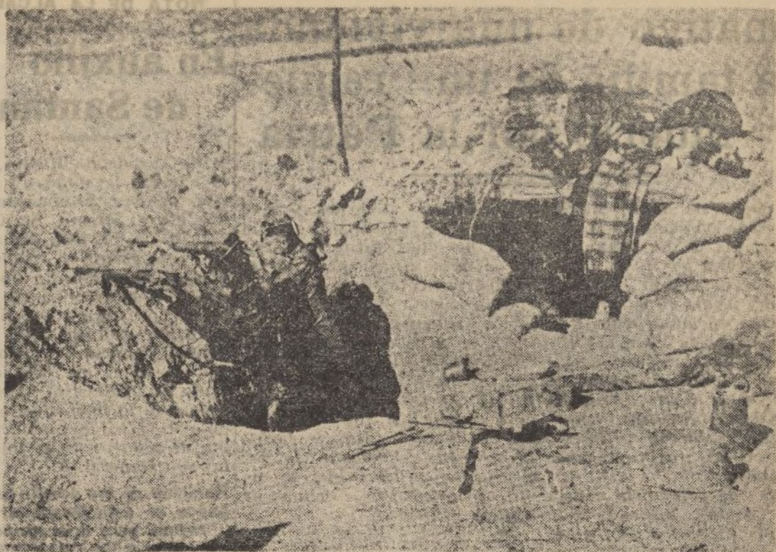
Refugios enemigos que nuestros bravos soldados utilizan en sus incontenibles avances.

Talleres, 1324 Administración, 1370 Papelería, 1477