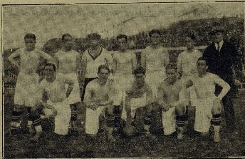
Celta de Vigo, que ganó al Sporting de Gijón en partido de desempate, y vencedor en los cuartos de final de la Real de San Sebastián.

Heckel, aunque cierto, creemos que, aun en el caso de ser el sujeto débil, más vale el que haya un predominio de dorsales que no de pectorales. Luego la tendencia es