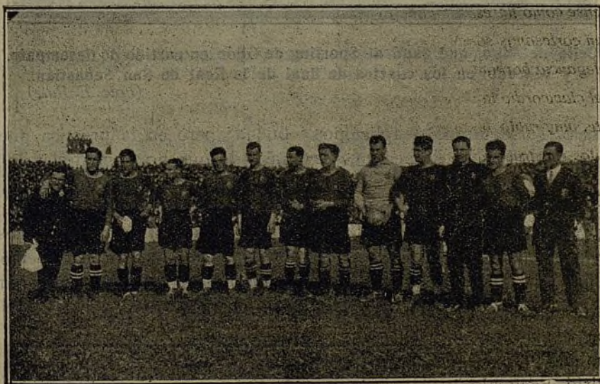
El equipo del Barcelona que ganó al Real Madrid en el primer cuarto de final.

(El mejor de los ejercicios respiratorios es el que se hace automáticamente por la exageración de la ventilación pulmonar. Es una necesidad orgánica que no vamos