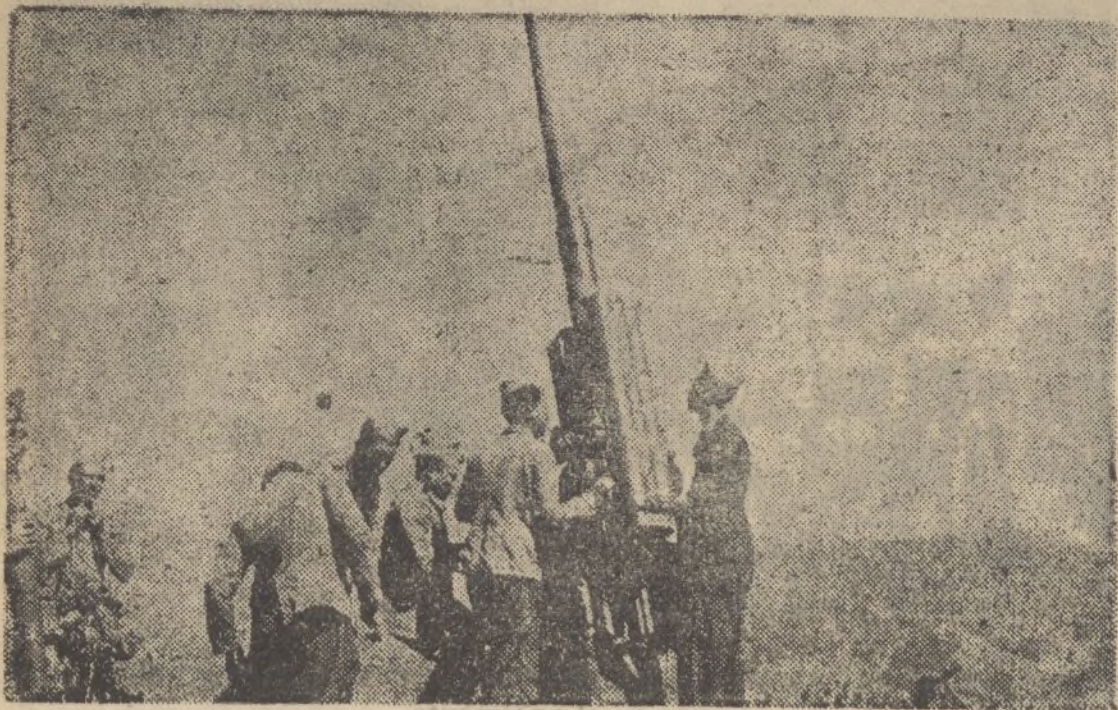
Nuestros soldados preparando una batería antiárea.