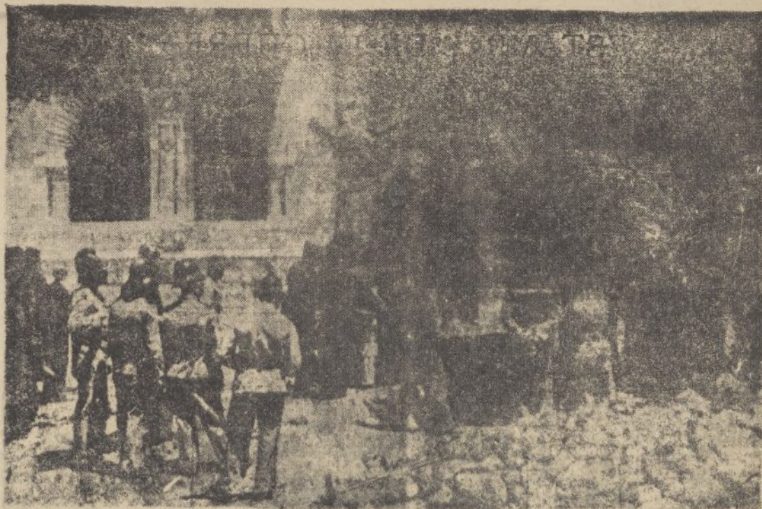
Lugar donde estalló la bomba, que, afortunadamente, sólo produjo algunos destrozos en el pavimento

Del criminal atentado frustrado contra Oliveira Salazar