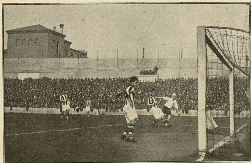
Dos momentos interesantes del partido Real Madrid Real Gimnástica Española, celebrado el domingo