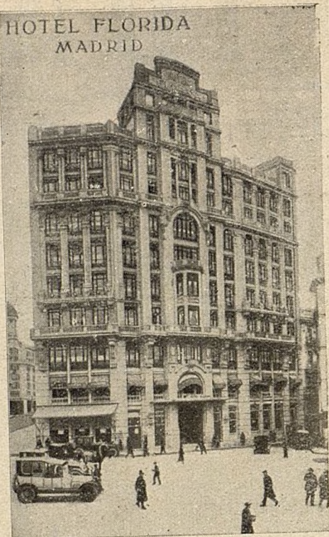
HOTEL FLORIDA MADRID