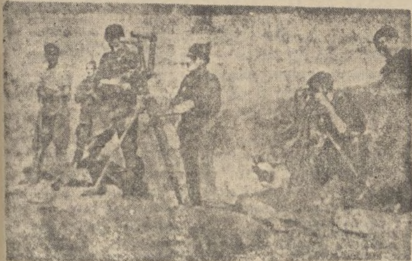
Un puesto de observación en el frente nacional de Vizcaya