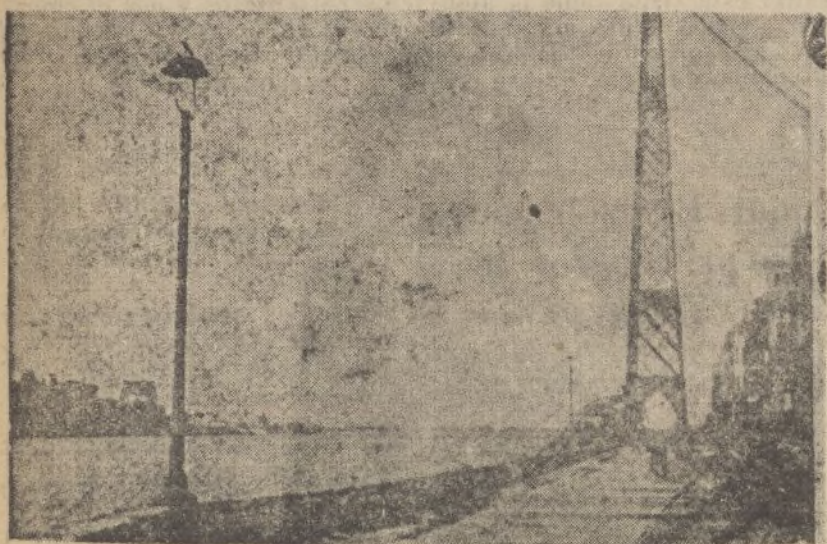
El puente colgante de Vizcaya, destruido por los rojos.