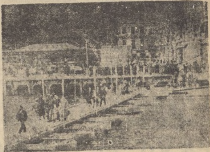
Puente de barcasas, construido por nuestros ingenieros en Bilbao