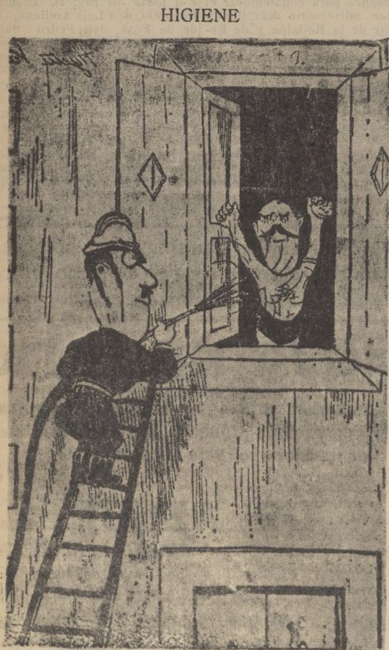
El capitán de bomberos toma su ducha diaria.