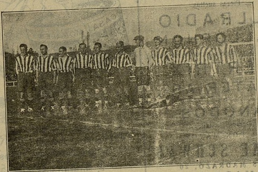
Equipo del Athlétic que medirá sus fuerzas con el Real Unión de Irún.