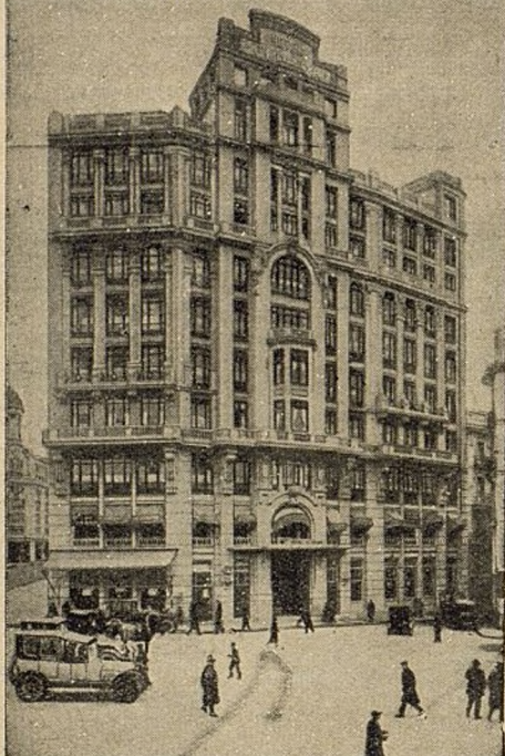
HOTEL FLORIDA MADRID