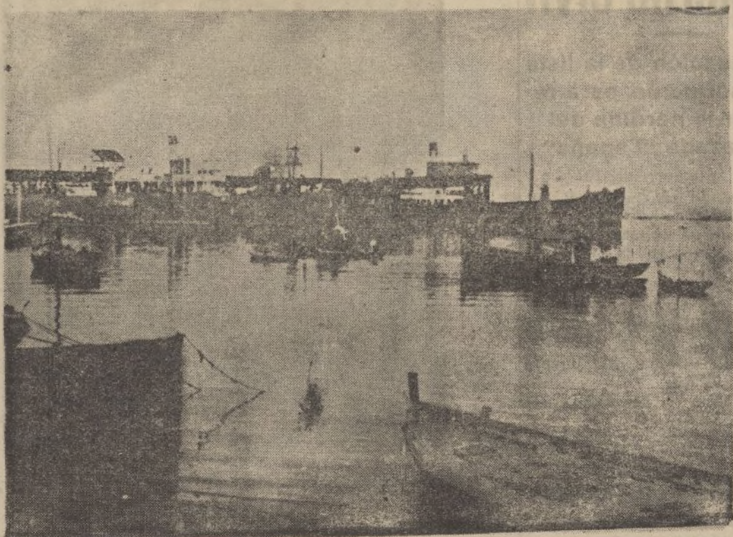
Expléndido aspecto de nuestra ría, con el muelle de Río Tinto al fondo.