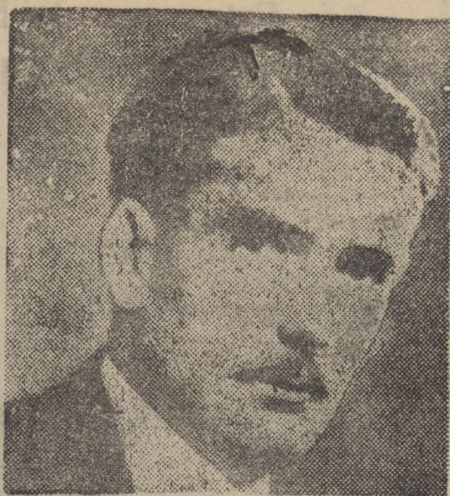
Anthony Eden, ministro de Relaciones Exteriores de Inglaterra.