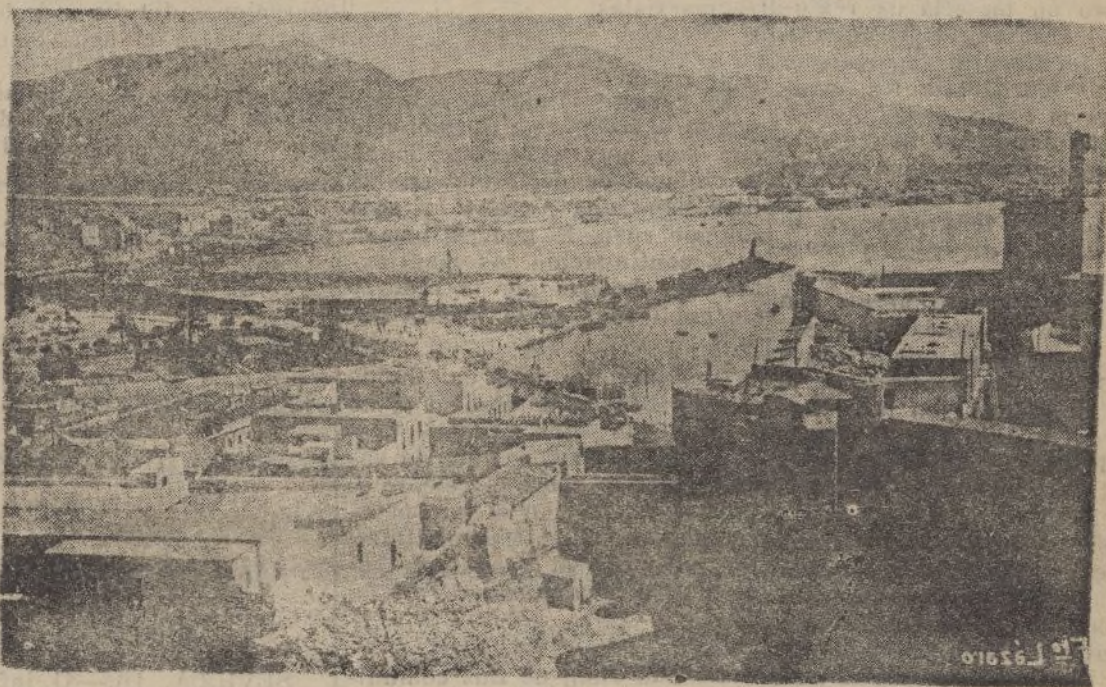
Vista general del puerto de Melilla

Melilla, punto inicial, el 17 de Julio, del glorioso Alzamiento Nacional