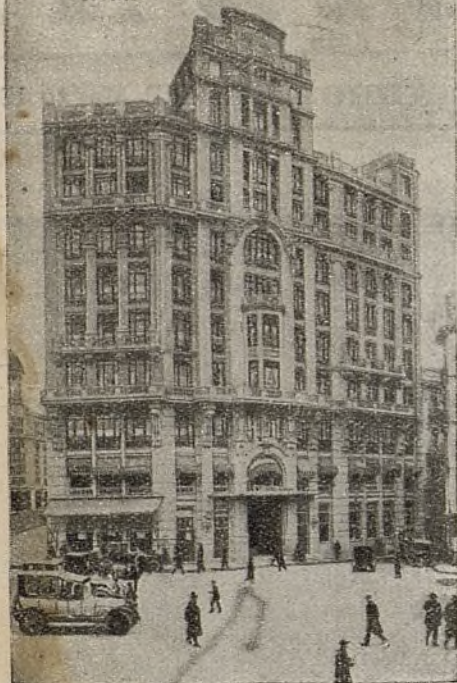
HOTEL FLORIDA MADRID