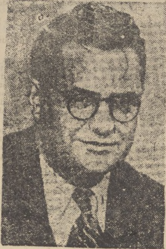
Doriot, jefe del Partido Nacional francés, formidable y popularísimo adversario de la política comunista que en Francia comenzó a actuar bajo el nefasto Gobierno de León Blum,