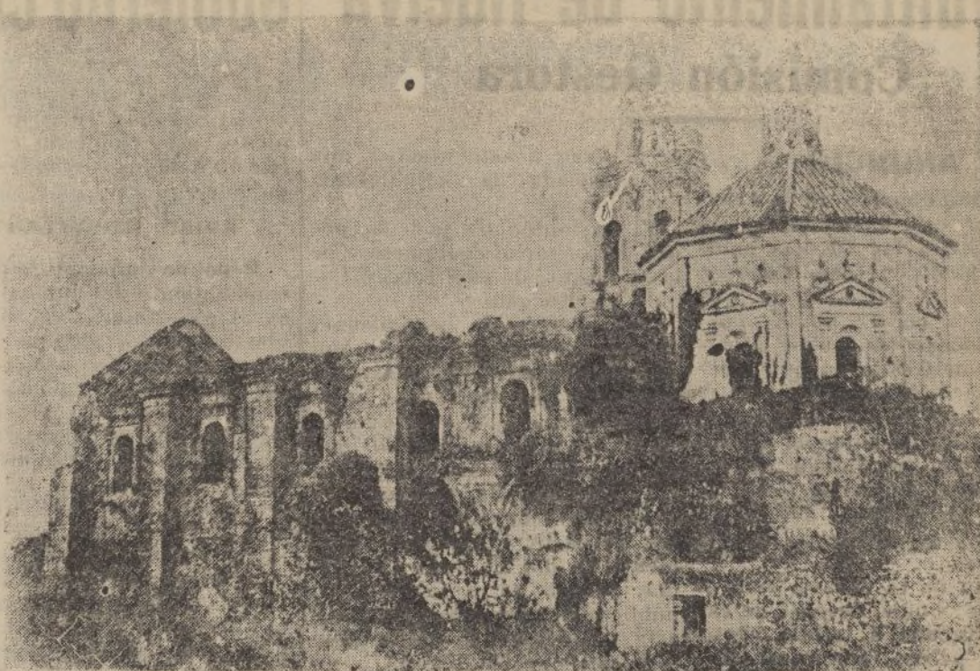
Cazalla de la Sierra. Ruinas del Monasterio de la Cartuja

Ningun placer en retaguardia sin algún sacrificio por la vanguardia