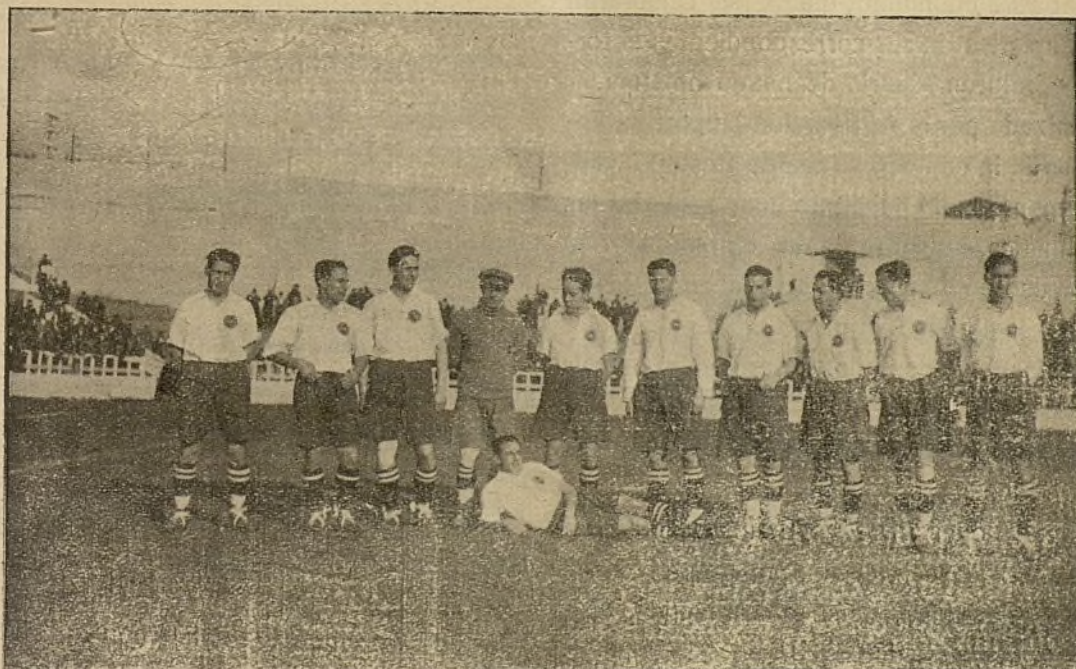
El equipo del Real Madrid que, después de sus brillantes actuaciones en América, vuelve a hallarse entre nosotros.

Empieza el juego con un buen ataque de los gijoneses llevado por la derecha, por lo que Cosme tiene que apretar, pero Ferreira