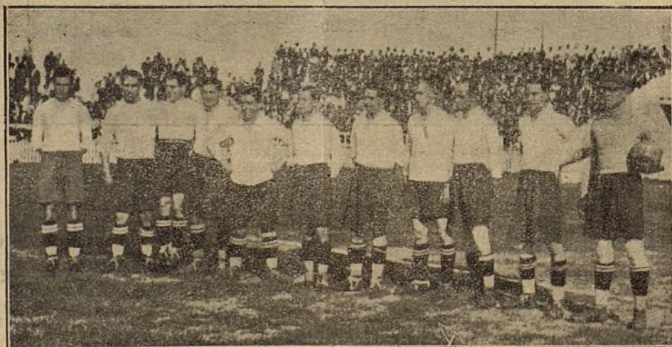
El equipo del Deportivo Español de Barcelona que, el pasado domingo, venció por 2 a 0 al Sabadell.