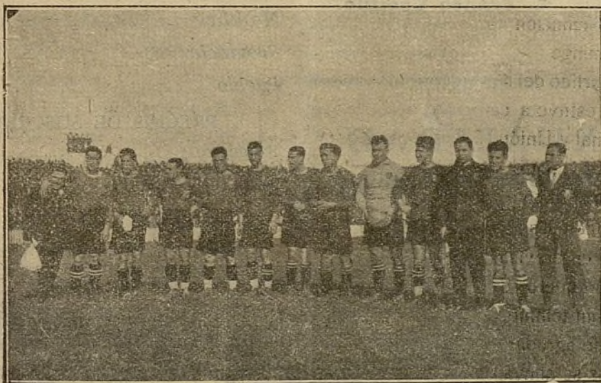
El equipo del Barcelona, F. C., que el pasado domingo batió al de la U. S. de Sans, por 6 goals a 0 en el campo de las Cortes.

«Faut» que tira Peña (J. M.) y remata Félix contra el larguero.