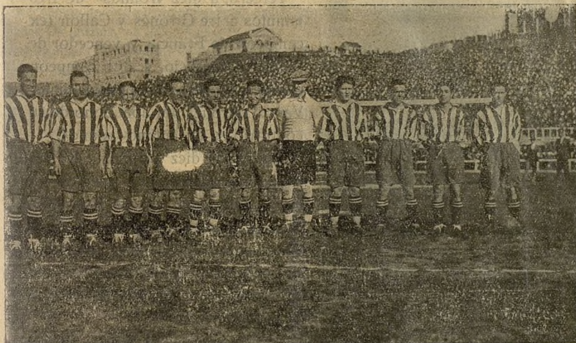
LOS EQUIPOS QUE TRIUNFARON El Athlétic Club en «sus buenos tiempos»

En el segundo tiempo la Gimnástica sale con ganas de dominar, pero