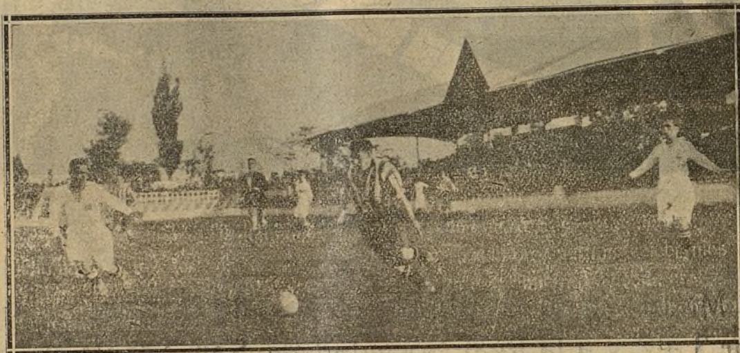
Una jugada del partido MADRID-AHTLÉTIC

A los pocos minutos de juego avanza el Nacional y marca el primer tanto. La Gim-