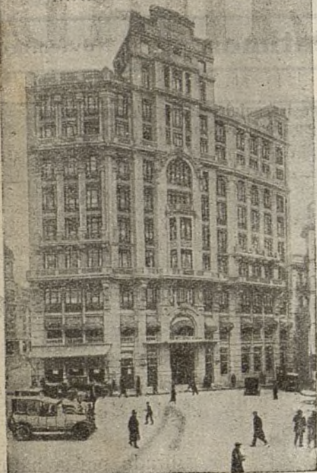
HOTEL FLORIDA MADRID