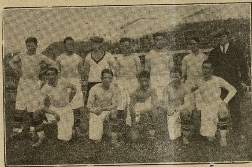
El Club Celta que en Vigo ha vencido por 6 a 1 a la Unión Sporting en partido celebrado el pasado domingo.

Olaso (L.) que se lesionó en un entrena-