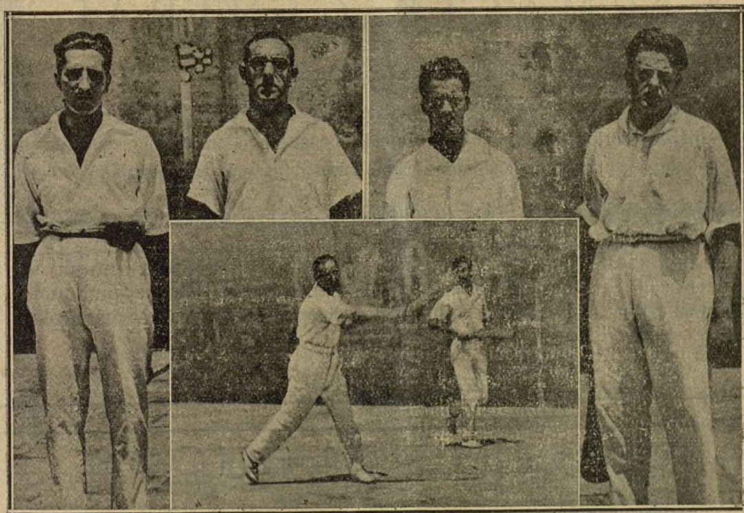
Los contendientes en el último campeonato de tennis.